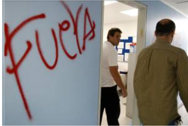
"החוצה". גרפיטי שצויר על ידי אלמונים על קיר בית הכנסת בקראקס בירת וונצואלה (31 בינואר, 2009)

ג. יצירת תשתית לפגיעה מדינית ביחסים בין ישראל לבין מדינות אמריקה הלטינית , דוגמת ניתוק הקשרים הדיפלומטיים של ונצואלה ובוליביה עם ישראל בעת מבצע "עופרת יצוקה". זאת ועוד, הדבר יוצר אווירה ואף תשתית פוליטית-פנימית המעודדת פגיעה בקהילות יהודיות באמריקה הלטינית כדוגמת הגברת ההתקפות על הקהילה היהודית בוונצואלה (פגיעה בבית הכנסת היהודי בקראקס).