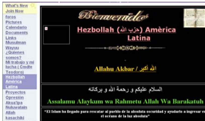
בלוג של חזבאללה באמריקה הלטינית

64. אתר אינטרנט של גוף המתקרא חזבאללה באמריקה הלטינית החל לפעול מספר חודשים לפני ניסיון הפיגוע שביצע חזבאללה וונצואלה נגד שגרירות ארה"ב בקרקאס (23 באוקטובר, 2006). אתר האינטרנט הציג עצמו כ"שופר של חזבאללה באמריקה הלטינית". האתר נכתב בשפה הספרדית ובשפת צ'אפטיקה, שילוב של שפת המאיה וספרדית עתיקה. למרות שהאתר טוען שהוא פעיל בארגנטינה, צ'ילה, קולומביה, אל סלוואדור ומכסיקו, הוא משרת בעיקר את הגוף המפעיל את האתר, המציג עצמו כאוטונומיה האסלאמית של וואיו (Autonomia Islamica Wayuu), שמנהיגה הוא תאודורו רפאל דארנוט 50 .