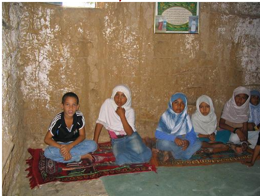
התמונה בהגדלה בה נראות בנות שבט הוואיו עוטות כיסוי על ראשן.