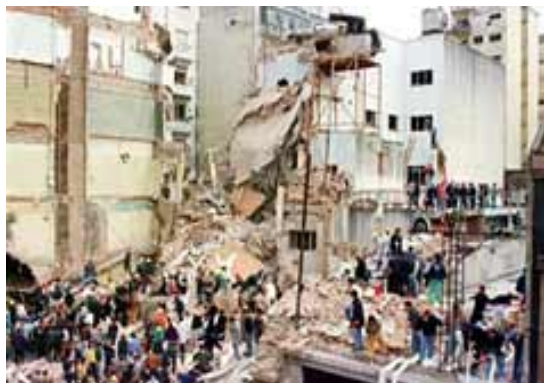
ההרס בבניין הקהילה היהודית אמיה בבואנוס איירס (יולי 1994)