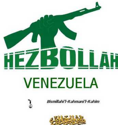
לוגו של חזבאללה וונצואלה השואב השראתו מזה של חזבאללה הלבנוני

63. לבני שבט הוואיו ולארגון חזבאללה וונצואלה אתרי אינטרנט ובלוגים המזדהים עם ערכי המהפכה האסלאמית באיראן ועם מסרי האלימות של חזבאללה ומטיפים לשנאה עם שנאה כלפי ארה"ב ואף כלפי ישראל והעם היהודי. ביטויים לכך הופיעו בשנים האחרונות באינטרנט בבלוגים שעדיין פעילים, אף כי אינם מתעדכנים ככל הנראה מרצון להוריד פרופיל ולהיות פחות חשופים.