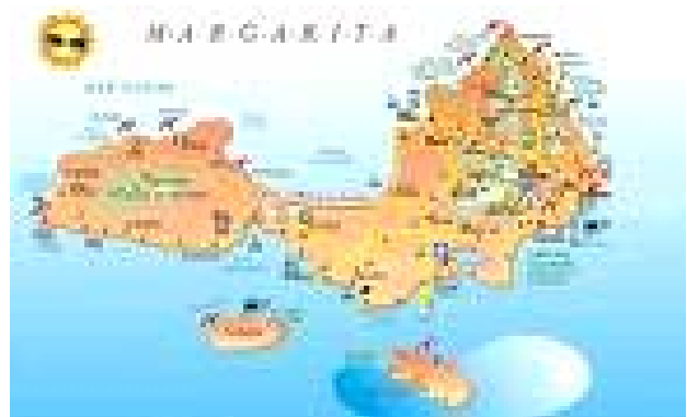
האי מרגריטה בחופה הצפוני של וונצואלה

53. האידיאולוגיה הלוחמנית האנטי-אמריקאית, שאימץ לעצמו חזבאללה וונצואלה, וקשריו האפשריים עם חזבאללה הלבנוני, באו לידי ביטוי גם במישור המבצעי-טרוריסטי . ב-23 באוקטובר 2006 נמצאו שני מטעני נפץ ליד שגרירות ארה"ב בקראקס בירת וונצואלה. מטעני הנפץ הללו לא התפוצצו. אחד המטענים נמצא בתוך קופסא שהכילה כרוזים בשם