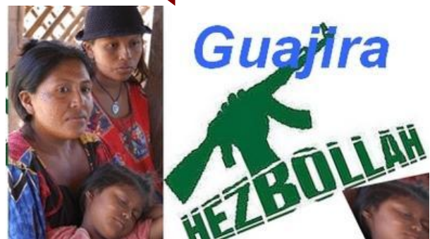
התמונה בהגדלה ובה מופיעה הכתובת "גואחירה חזבאללה" על רקע יד המניפה רובה סער (סמל הלקוח מהלוגו של חזבאללה). בחצי האי גואחירה, שבגבול שבין ונצואלה לקולומביה, מתגוררים שני שבט הוואיו והכתובת נועדה לסמל את הזדהותם עם חזבאללה.