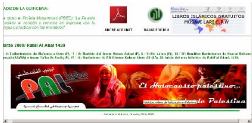
קישור לאתר PALTUBE של חמאס

62. בתחתית עמוד הבית של האתר Semamario Islamico מופיע קישור לאתר PALTUBE של חמאס . המדובר באתר שיתוף קבצים אשר עלה בתחילת שנת 2009 לאינטרנט ומכיל סרטונים וקבצים המקדמים את מסרי הטרור והשנאה של חמאס 49 .