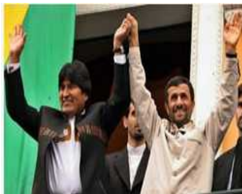
אחמדינז'אד ואיוו מורלס

28. לקראת ביקור הגומלין באיראן של איוו מורלס, נשיא בוליביה (1 ספטמבר 2008), פרסם העיתון האיראני סיאסט רוז (1 ספטמבר 2008), כתבת תחקיר על יעדי מדיניות החוץ של איראן באמריקה הלטינית. העיתון כתב כי למרות עוניו של האזור הוא ממלא תפקיד חשוב במשוואות האזוריות העולמיות בעיקר בכל הקשור ל" בלימת גידול האימפריאליזם ". בהקשר זה יצוין כי מדינות כמו רוסיה, סין, האיחוד האירופי ואפילו ארצות הברית חשות לאזור לקדם את האינטרסים הפוליטיים והכלכליים שלהם. עובדה זו הופכת את הקשרים בין איראן לאמריקה הלטינית להכרחיים. על כן הרחבת היחסים בין איראן לבין מדינות כמו בוליביה, ונצואלה וקובה, הנהנות ממעמד מיוחד בדרום אמריקה, יכולה להוות בסיס לנוכחות איראנית אקטיבית יותר באזור כולו. הדבר יכול להוביל לרווחים רבים עבור איראן במישור הפוליטי והכלכלי. הכתבה מציינת, כי פעילות כזו ב"חצרה האחורית" של ארצות הברית יכולה להסיט את מימדי האיום האמריקאי מגבולותיה של איראן.