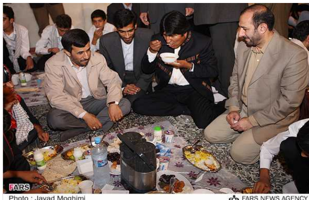
אחמדינז'אד ונשיא בוליביה במהלך סעודה לשבירת הצום

איראן אחמדינז'אד ואמר, כי הוא מעוניינים לקדם את שיתוף הפעולה עם איראן בתחומים רבים ולקדם פרויקטים שונים "ברוח שיתוף הפעולה האנטי-אימפריאליסטי" 25 . מורלס גם הבטיח להעביר את שגרירות בוליביה מקהיר לטהראן.