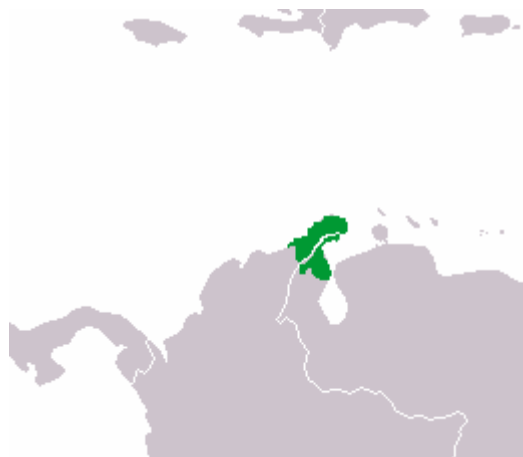
מפת אזורי שבט הוואיו על גבול ונצואלה וקולומביה

שהקלו על חדירת האסלאם לאזור שבט הוואיו. עם עלייתו לשלטון, הכריז נשיא ונצואלה הוגו