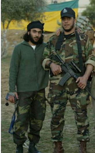
ממתז דע'מש (מימין) עם אחד מאנשיו (פורום חמא"ס, 24 ינואר 2007)

14. ברצועת עזה פועלים מספר ארגונים תחת אידיאולוגית הג'האד העולמי שהוותיק שבהם הוא צבא האסלאם בראשותו של ממתז דע'מש. לצידו פועלים ארגונים נוספים דוגמת פתח אלאסלאם באדמת הרבאט, צבא האומה, ומספר גופים קטנים נוספים. פעילותם מתבטאת בעיקר בהפצת רעיון הג'האד ופעילות מבצעית מצומצמת המכוונת, לפי שעה, בעיקר נגד אוכלוסיית הזרים והלא מוסלמים ברצועת עזה 6 . סביר להניח כי התארגנויות מקומיות אלו עושות שימוש באינטרנט לשם אכוונה אידיאולוגית ומבצעית מאלקאעדה וגורמי הג'האד העולמי.