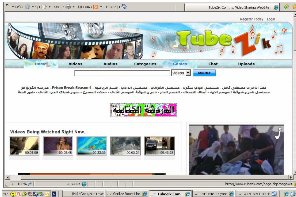
עמוד הבית של אתר אקצא טיוב במתכונתו החדשה (26 בינואר)