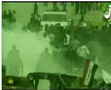
תמונה מתוך סרטון הסתה של חמאס המופיע בעמוד הבית של אתר אקצא טיוב במתכונתו החדשה (26 בינואר)