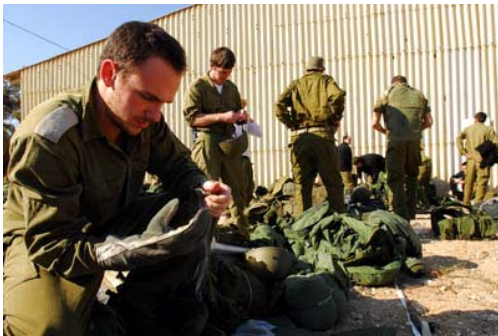
חיילי מילואים מתארגנים לקראת כניסה לעזה (דובר צה"ל, 4 בינואר)

■ ב-4 בינואר, לאחר אישורו של הקבינט המדיני בטחוני, הורחב גיוס אנשי המילואים. אלפי חיילי מילואים הגיעו לקליטה בבסיסים והם נערכים לקראת פעילות קרקעית ברצועת עזה. החיילים המשיכו לבסיסי אימונים בדרום הארץ, שם יתאמנו עד אשר יקראו להיכנס לרצועה (דובר צה"ל, 4 בינואר).