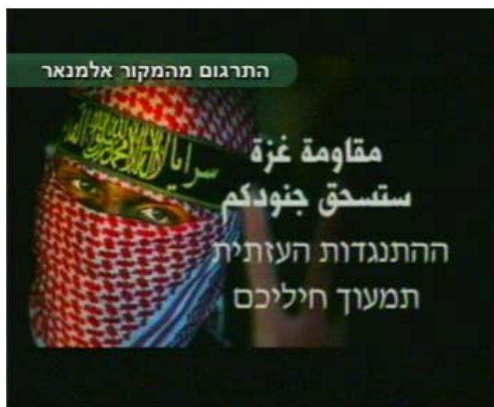
מעברון בערוץ אלמנאר של חזבאללה המביע ביטחונו בניצחון ארגוני הטרור ברצועה (ערוץ אלמנאר, 5 בינואר)

המועצה האיראנית העליונה ג'לילי ביקר בסוריה ונועד עם ראשיה (איסנא, 3 בינואר). כלי התקשורת הסורים ממשיכים בשידורי הסתה אינטנסיביים סביבי פעולות צה"ל ברצועה תוך הצגת תמונות פצועים והרוגים מהרצועה.