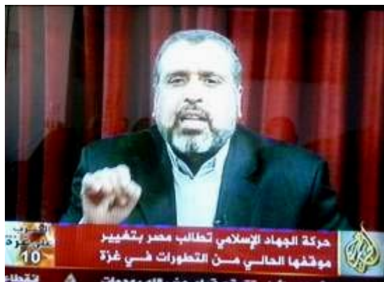
מנהיג הג'האד האסלאמי בפלסטין רמצי'אן שלח: שליחת כוחות בינלאומיים לעזה תביא לפגיעה בכוחות אלה (אלג'זירה, 5 בינואר 2009)

■ ראש ממשלת תורכיה רג'ב ארדיאן , סיים סבב ביקורים במדינות המזרח התיכון. במהלך פגישותיו הוא נועד עם ראשי ירדן, סעודיה, הרשות הפלסטינית ומצרים והציג בפניהם תוכנית תורכית בת שני שלבים לסיום הלחימה ("מפת דרכים תורכית"). התוכנית מתבססת על חידוש הסדר ה"הרגעה" בין חמאס לישראל באמצעות מצרים למשך שנה והיא כוללת פתיחת המעברים, בדגש על מעבר רפיח. על פי התוכנית התורכית יתפרסו ברצועת עזה כוחות בינלאומיים דוגמת יוניפי"ל בלבנון, שיכללו כוחות מתורכיה וממדינות אסלאמיות נוספות, על מנת לפקח על ה"הרגעה" ולמנוע ירי רקטות לעבר ישראל (סוכנות הידיעות המזרח תיכונית, 4 ינואר) רעיון הצבת כוחות בינלאומיים ברצועת עזה זכה לתגובה שלילית מיידית מצדו של רמצי'אן שלח , מנהיג הג'האד האסלאמי בפלסטין, שאיים כי שיגור כוחות בינלאומיים לרצועת עזה יביא לפגיעה בהם.