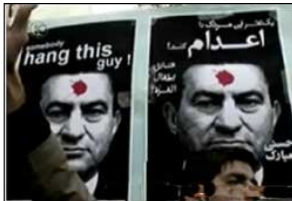
פוסטרים ובהם קריאה לתלות את הנשיא מבארכ (Iran press news, 5 בינואר)

• ההתקפות קשות נגד מצרים והנשיא מבארכ. ארגון סטודנטים איראני המתקרא "ארגון שוחרי הצדק האיראנים" 2 הוציא פרס בן מליון דולר לכל אדם ברחבי העולם שירצח את "הנשיא המצרי הפושע" חסני מבארכ (פארס, 4 בינואר). סטודנטים איראנים, שהתבצרו בשדה התעופה משהד, דרשו מממשלת איראן לסגור את מיצרי הורמוז "עד שהמשטר המצרי הבוגד יפתח את מעבר רפיח" (סוכנות הידיעות פארס, 4 בינואר).