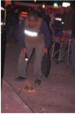
פינוי רקטה שנפלה במרכז העיר שדרות (צילום: זאב טרכטמן, 4 בינואר)

■ במהלך היממה האחרונה נפלו בשטח ישראל 30 רקטות , מהן שלוש רקטות 122 מ"מ גראד כמו כן נפלו שבע פצצות מרגמה. מספר רקטות נפלו באשקלון, באשדוד ובשדרות וסביבתה. כשלושה אזרחים נפצעו ו-11 לקו בהלם. כמו כן נגרם נזק לרכוש. בנוסף נורו מספר רב של פצצות מרגמה לעבר כוחות צה"ל הפועלים ברצועה. סה"כ נפלו מתחילת מבצע "עופרת יצוקה" 325 רקטות ו-122 פצצות מרגמה .