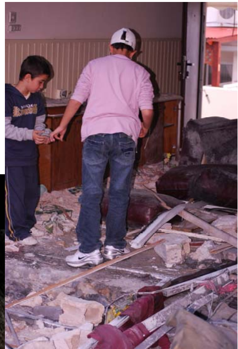
פגיעה ישירה בבית בשדרות (צילום: זאב טרכטמן, 4 בינואר)