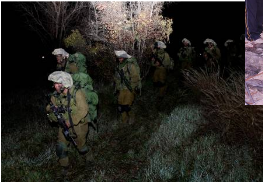
חיילי צה"ל יוצאים לפעילות קרקעית ברצועת עזה (Reuters, 3 בינואר. צילום: באז רטנר)