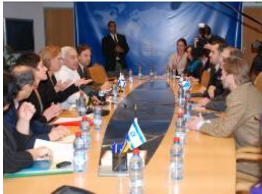
שרת החוץ ציפי לבני ונציגי ארגוני הסיוע הפועלים ברצועה (משרד החוץ, 4 בינואר)

■ השרה עדכנה במפגש את ראשי הארגונים על פתיחת חמ"ל הומניטארי חדש של משרד החוץ ומתאם הפעולות בשטחים, שתפקידו לטפל בבקשות ההומניטאריות של הארגונים השונים ולסייע לפתרון בעיות. נציגי ארגוני הסיוע ברכו על היוזמה וקראו להרחיב את שיתוף הפעולה והסיוע במהלך ימי המבצע.