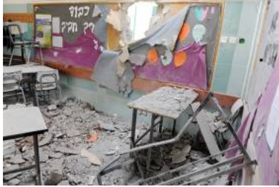
כיתת בית הספר שנפגעה בבאר שבע (משה"ח, 31 בדצמבר)