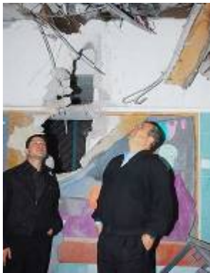
שר הביטחון אהוד ברק בוחן את הנזק שנגרם לכיתה (צילום: הרצל יוסף, ynet, 31 בדצמבר)

17. ב-31 בדצמבר, בשעה 08:45 נפלה רקטה נפלה בבית הספר באחת משכונות העיר. כתוצאה מנפילת הרקטה נפער חור בקוטר של כמטר וחצי בתקרת אחת הכיתות. למבנה נגרם הרס רב. בבית הספר לא התקיימו לימודים בעקבות החלטה מוקדמת של פיקוד העורף וראש העיר. מספר רקטות נוספות נפלו ברחבי העיר ובפאתיה, לא היו נפגעים ולא נגרם נזק.