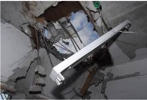
החור שנפער בגג כיתת בית הספר (צילום: הרצל יוסף, ynet, 31 בדצמבר)

16. ב-30 בדצמבר, סמוך לשעה 21:00 בערב נפלה רקטה בגן ילדים באחת השכונות בעיר באר שבע. לגן נגרם נזק. במקום לא שהו ילדים בשל השעה המאוחרת. אזרח ששהה סמוך למקום נפצע באורח קל ומספר נוספים לקו בהלם.