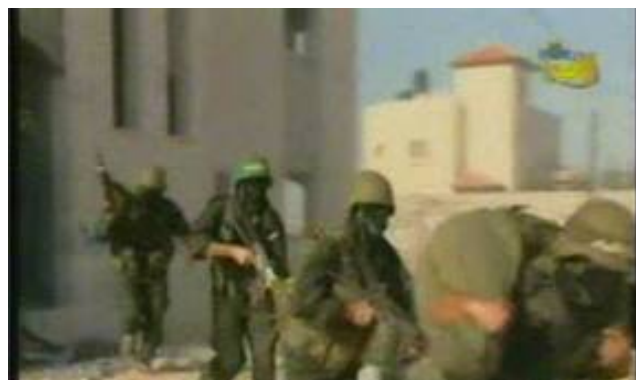
פעילי חמאס/גדודי עז אלוין אלקסאם באימונים צבאיים במחנה הפליטים אלנציראת (ערוץ אלאקצא, 30 באוקטובר)