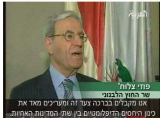
שר החוץ הלבנוני פוזי צלוח' מברך על כינון הקשרים הדיפלומטיים בין סוריה ללבנון.