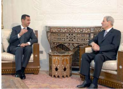
בשאר אלכסנדר נפגש עם פואד סניורה, שר החוץ של לבנון

א. ראש הממשלה פואד סניורה , תאר את כינון הקשרים הדיפלומטיים כ"צעד היסטורי" בדרך לקראת ביסוס עצמאות לבנון, ריבונותה וחופש ההחלטה שלה. לדבריו מדובר בצעד יסודי בדרך לחיזוק הקשרים בין סוריה ללבנון על בסיס של כבוד הדדי (אלספיר, 15 באוקטובר, 2008).