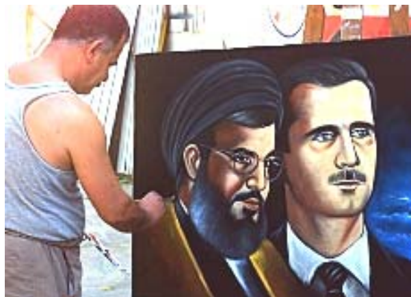
אמן סורי מצייר בדמשק תמונת פורטרט של אסד ונצראללה (16 ליולי 2006)

גובלן המופץ בדמשק ובו מופיעה דמותו של חסן נצראללה לצד זו של בשאר אסד. בגובלן אחר המופץ בדמשק מופיעה דמותו של חסן נצראללה יחד עם בכירי המשטר בסוריה. במרכז מופיעות דמויות חאפט' ובשאר אסד, משמאלם שוכת עאצף ומאהר אסד ומימין חסן נצראללה. למטה מופיעה הכתובת : "אומה שראשיה הם אריות לא תכרע לעולם ברך".