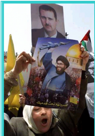
חזבאללה כשותף אסטרטגי : תמונותיהם של נשיא סוריה, בשאר אסד, ושל מנהיג חזבאללה נצראללה מונפות זו לצד זו בהפגנה בדמשק