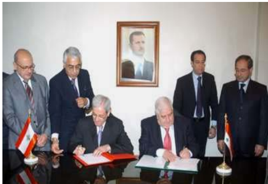
שרי החוץ של סוריה ולבנון חותמים על ההודעה המשותפת בדבר כינון קשרים דיפלומטיים

2. יום לאחר פרסום הצו הסורי, הגיע פוזי צלוח', שר החוץ הלבנוני, לביקור בסוריה. הוא נפגש עם הנשיא בשאר ועם וליד מעלם, שר החוץ הסורי. שני שרי החוץ חתמו ב-15 באוקטובר לפנות בוקר על הודעה משותפת בדבר כינון יחסים דיפלומטיים. בהודעתם המשותפת הם הדגישו כי סוריה ולבנון שואפות להדק את "יחסי האחוה המצוינים בין שתי המדינות האחיות", על בסיס של כבוד הדדי כלפי ריבונותה ועצמאותה של כל אחת מהמדינות. שר החוץ הסורי, בתשובה לשאלת אחד העיתונאים, ציין כי מינוי שגריר סורי בלבנון יתבצע לפני תום 2008 (סוכנויות הידיעות של סוריה, ולבנון, 15 באוקטובר, 2008).