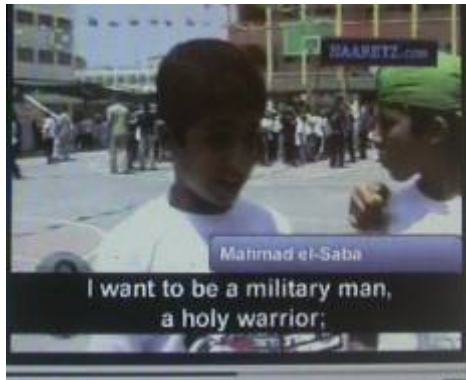
ילד המשתתף במחנות הקיץ של חמאס עונה לשאלה "מה אתה רוצה להיות שתגדל?": "אני רוצה להיות איש צבא, לוחם ג'האד, כדי לשחרר את האדמה הזו, שכן אדמה זו שלנו ולא של אחרים".

9. על טיבו של ה"חינוך" הניתן בגן הילדים ניתן ללמוד מטקס מסיבת סיום של מחזור 29 של גני ילדים המשתייכים לאגודת אלמג'מע אלסלאמי , אחת מאגודות הצדקה הגדולות של חמאס 6 . בטקס שנערך ב- 31 במאי 2007 ושודר בטלוויזיית אלאקצא של חמאס, צעדו ילדים לובשי מדים, כמה מהם רעולי פנים, נושאים רובים מפלסטיק וחרבות. הילדים ביצעו תרגילי לחימה, קפיצות, זחילות והנפת חרבות. ברקע נשמע שיר הלל לחמאס בו נאמר כי "איש חמאס אינו ירא מהמוות". בטקס קרא אחד הילדים: "מהי הדרך שלכם" והילדים ענו: "הג'האד"; "מהי השאיפה הגדולה ביותר שלכם?" והילדים ענו: "חמאס"; "מהו הצבא שלכם?" והילדים ענו: