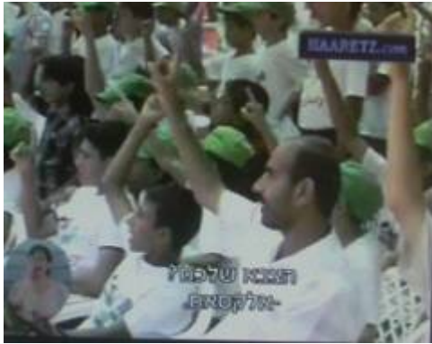
הילדים נשאלים "מי הצבא שלכם?" ועונים: "גדודי עז אלדין] אלקסאם 5 [הזרוע הצבאית- הטרוריסטית של החמאס].