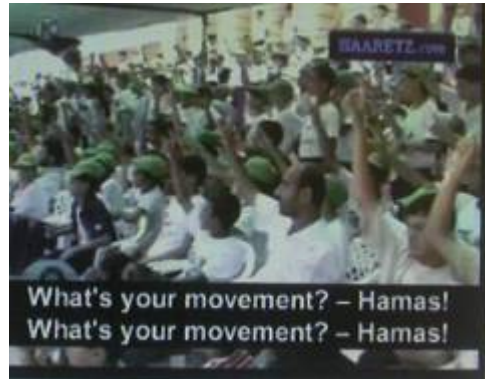
הילדים נשאלים "מי התנועה שלכם?" ועונים: "חמאס".