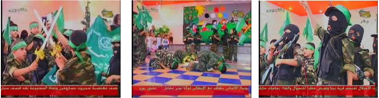
תמונות מטקס מסיבת סיום של גני ילדים, שערכה אגודת אלמג'מע אלסלאמי (ערוץ אלאקצא של חמאס, 31 במאי 2007)

"[גדודי עד אלדין] אלקסאם". תמונות דומות פורסמו גם בטקס סיום שנערך בגן ילדים בשנת 2001. 7