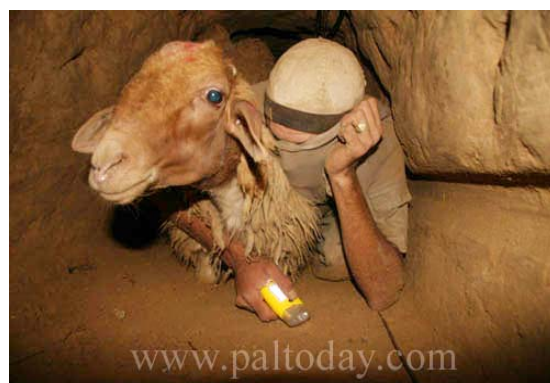
הברחת צאן ובקר דרך המנהרות

9. קיומה של רשת המנהרות הענפה מאפשר זרימת סכומי כסף גדולים וכמויות גדולות של מוצרי מזון לרצועת עזה. כתוצאה מכך, בניגוד לתעמולת חמאס, ניכר לאחרונה כי לא קיים מחסור במוצרי מזון ברצועה ובמוצרים מסוימים אף קיים שפע. ביטאון חמאס אלרסאלה אף פרסם כתבה אודות השיפור שחל במצב הכלכלי ברצועה בשל מעבר מגוון רב של סחורות זולות דרך המנהרות. מעבר הסחורות מאפשר לתושבי הרצועה להצטייד במוצרים אותם קשה היה להשיג עד כה. על פי הכתבה המנהרות פתרו גם את בעיית המחסור בדלק לאחר שהנחוו בחלק מהן צינורות מיוחדים באמצעותם מועבר גז ממצרים לרצועה (אלרסאלה, 16 באוקטובר). ואכן, לאחרונה, הוצפו שוקי הרצועה בדלקים ממצרים (כולל גז לבישול) ובעקבות זאת ירדו מחירי הדלקים אל מתחת למחיר הרשמי.