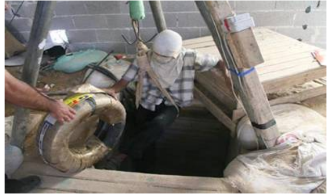
פעילות ההברחה במנהרות ( המקור: פורום PALDF של החמאס, 23 באוקטובר)