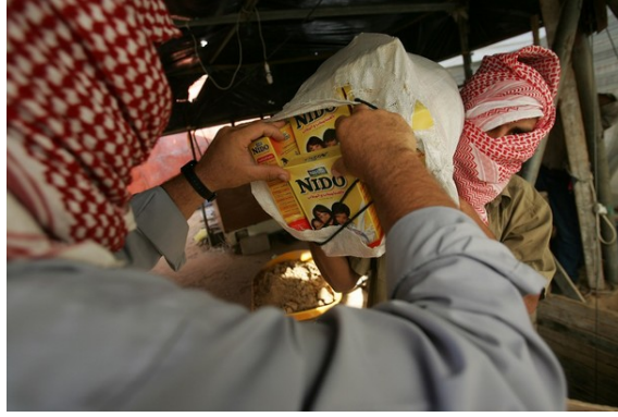
הברחת מצרכי מזון דרך המנהרות