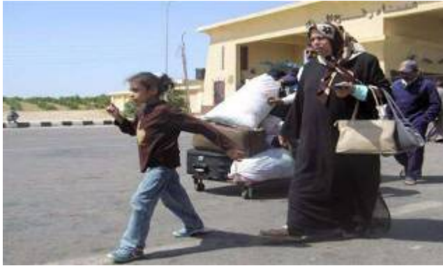
פלסטינים עוברים במעבר רפיח ב-20 בספטמבר (סוכנות רמאתאן, 20 בספטמבר)

■ דובר חמאס, פוזי ברהום הביע מורת רוחו מסגירת המעבר ב-21 בספטמבר (שעות ספורות לאחר שהחל לפעול) והציג זאת כ"הונאת הפלסטינים" וכ"מעשה התגרות". הוא אף תבע ממצרים לחקור את הסיבות ל"פשע ההומניטארי" הזה. לדבריו משלחת חמאס העומדת לצאת למצרים תדון בנושא זה עם ההנהגה המצרית (ערוץ אלאקצא, 22 בספטמבר).