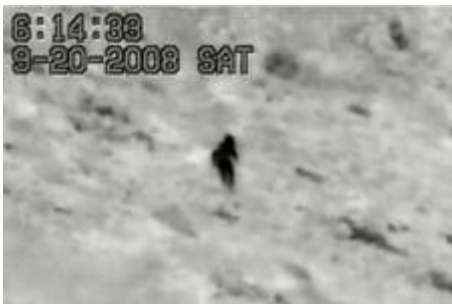
המחבל כפי שצולם בתצפית צה"ל. (צילום: דובר צה"ל, 20 באוקטובר)

■ ב- 20 בספטמבר, בשעות הבוקר המוקדמות, זיהתה תצפית צה"ל מחבל עולה מאחד הכפרים לכיוון הישוב יצהר, שמדרום לשכם. המחבל השליך לעבר כוח צה"ל ומג"ב בקבוק תבערה. בתגובה ירה הכוח לעבר המחבל והרגו. בסריקות שנערכו על גופתו של המחבל נמצאה סכין.