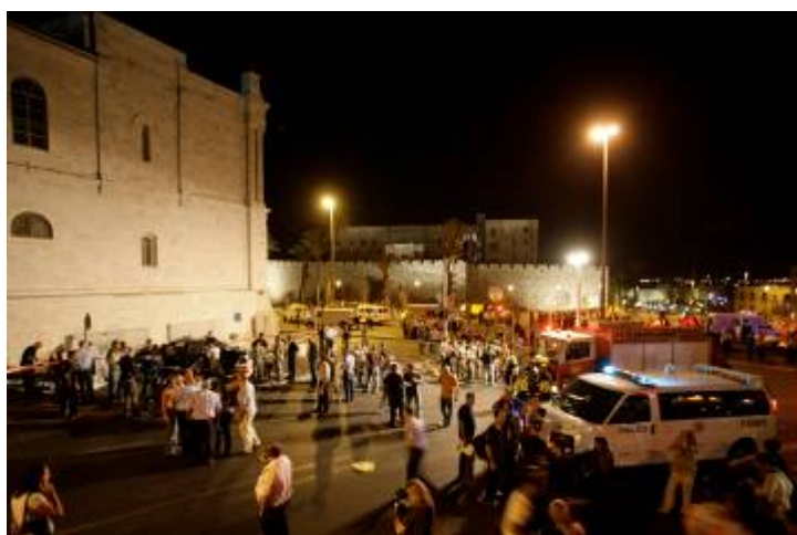
זירת פיגוע הדריסה במרכז העיר ירושלים (רויטרס, 22 בספטמבר. צילום: באז רטנר)