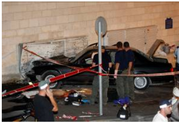
מכונית ה-BMW, אשר שימשה את המחבל בפיגוע הדריסה במרכז העיר ירושלים (22 בספטמבר)