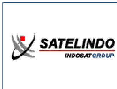
הלוגו של חברת Satelindo המפעילה את לוויין התקשורת, שמפיץ את שידורי אלמנאר

3. לוויין התקשורת האינדונזי PALAPA-C2 הינו דור שלישי של לוויני תקשורת ששוגר ב-1996. הלוויין נמצא בבעלות חברת Indonesia Telkom והוא מופעל ע"י קבוצת SATELINDO מג'קארטה, אינדונזיה. יצוין כי רוב מניות חברת Indonesia Telkom נמצאות בבעלות ממשלת אינדונזיה, שיש לה זכות וטו על החלטות אסטרטגיות. הלוויין מותאם בתכונותיו למזג האוויר הגשום של אינדונזיה וסביבותיה וכך הוא יכול לשדר כמעט ללא הפרעה. הלוויין מעביר שידורי וידאו, טלפונים סלולאריים וכן מספק שירותי גישה לאינטרנט 1 .