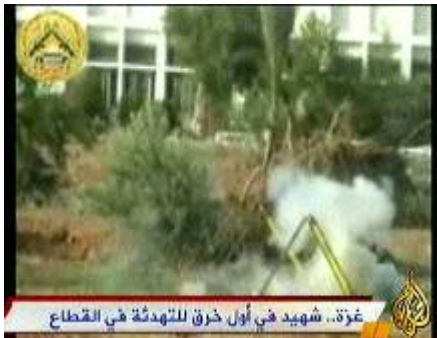
ירי רקטות של פת"ח/גדודי חללי אלאקצא (אלג'זירה, 10 ביולי)

● 8 ביולי - פצצת מרגמה נחתה בשטח פתוח במועצה אזורית אשכול. אף ארגון לא נטל אחריות על ביצוע הירי.