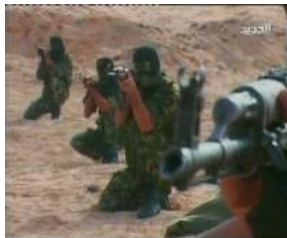
סרטון טלביזיה המראה אימונים שמקיים הג'האד האסלאמי בפלסטין בתקופת ה"הרגעה" (ערוץ N TV, 9 ביולי)