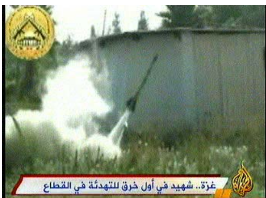
ירי רקטות של פת"ח/גדודי חללי אלאקצא (אלג'זירה, 10 ביולי)