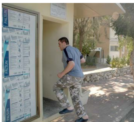
תושב שדרות נכנס למרחב מוגן עם הישמע התרעת "צבע אדום" (זאב טרכטמן, 10 ביולי)