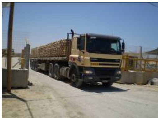
משאית עמוסה שקי מלט במעבר סופה

■ גם השבוע, כאמור לעיל, נמשכו הפרות ה"הרגעה", בעיקר ע"י התארגנויות פת"ח. בתגובה על ההפרות סגרה ישראל את המעברים לפרקי זמן קצרים (של מספר שעות), למשל ב- 9 ביולי. במעברי סופה ונחל עוז נמשך גם השבוע מעבר מוצרי מזון סחורות ודלקים לרצועת עזה בהיקף של כ- 70 משאיות ליום. במגוון הסחורות חלה התרחבות והחלה העברת כ-5 משאיות מלט ליום וכמות מוגבלת של ברזל לבנייה. תנועת חמא"ס ותושבי הרצועה מביעים אכזבה מהיקף פעילות המעברים ומלינים על מחסור בחומרי גלם לבנייה. לדבריהם המלט שהוכנס מועט ואינו עונה על הביקוש. (אלרסאלה, 10 ביולי; אלאים, 12 ביולי).