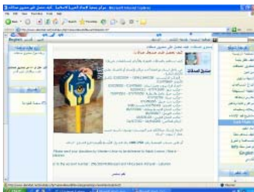
פרוט מספרי טלפונים וחשבונות בנק באמצעותם ניתן לתרום לאלאמדאד