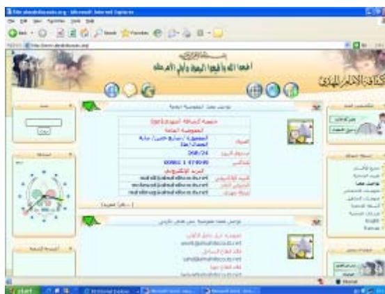
מספרי טלפון, פקס ודואר אלקטרוני של "צופי האמאם אלמהדי"