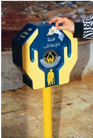
עמדה לאיסוף תרומות המוצבת ברחובות לבנון. (צילום מתוך האתר "של" "אלאמדאד").

13. לקרנות האיראניות המרכזיות, ולאגודת אלאמדאד בתוכן, יש שלוחות בלבנון באמצעותן הן מיישמות את תפיסתו של ח'מיני. החל משנת 2001 הועברו הקרנות בלבנון, ובהן אגודת אלאמדאד, לבעלותו ולניהולו של חיבאללה . לפיכך חיבאללה הוא זה הקובע את מדיניות אגודת אלאמדאד בלבנון ואת אופן ניצול תקציבה. בראיונות פומביים שהעניק במהלך שנת 2001, ציין חסן נצראללה, כי אגודת אלאמדאד הינה אחד מהמקורות הכספיים של חיבאללה בתחום החברתי (חיבאללה מגלה פעילות חברתית ענפה בקרב האוכלוסייה בקרבה הוא פועל, בעיקר השיעית, על מנת להגביר את אחיזתו ולגייס פעילים לשורותיו).