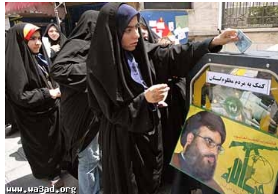
עמדה לאיסוף תרומות לאגודות הצדקה אמדאד באיראן (אתר "ועד", 1 באוגוסט 2006) 9 . למטה: דמותו של חסן נצראללה וסמל חיבאללה.

14. באתר שיעה ווב מופיעים מספרי חשבונות בבנקים דרכם ניתן להעביר תרומות עבור אגודת אלאמדאד ומספרי טלפון באמצעותם ניתן להסדיר את העברת הכספים. מרבית חשבונות הבנק ומספרי הטלפון נמצאים ב לבנון , אולם שני חשבונות בנק נמצאים ב- BLC Bank בפרז וב- Dresdner bank בפרנפורט . התורמים לחשבונות הללו מתבקשים להעביר את התרומות ביורו או בדולרים 10 .