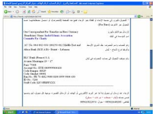
הנחיות להעברת תרומות לחשבונות בבירות ובפרנקפורט

BLC Bank (France) S.A Avenue Montaigne 19 - 17 Paris 75008 Account No.: EUR 0009999000430 Code Banque: 41829 Code Guichet: 00001 Ban No.: FR 76 4182 9000 0100 0999 9000 430 ID No.: 5266 Swift Code: LICOFRPPXXX