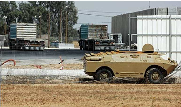
שריונית מסוג ב.ר.ד.מ, שנלקחה שלל ממנגנוני הביטחון של אבו מאזן, והופעלה בהתקפה על מעבר כרם שלום (צילום: דובר צה"ל, 19 באפריל)