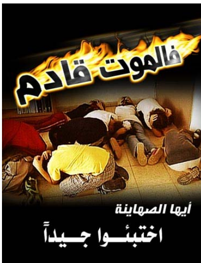
למעלה: "המוות קרב"; למטה: "הוי הציונים, התחבאו היטב"