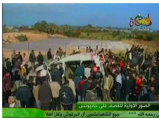
המכונית שהותקפה ע"י חיל האוויר בח'אן יונס (ערוץ אלאקצא, 27 בפברואר)

4. ב-27 בפברואר בשעות הבוקר תקף צה"ל שני כלי רכב בהם נסעו פעילי הזרוע המבצעית/טרוריסטית של חמא"ס בח'אן יונס. בתקיפה הראשונה ירה מסוק ירי שני טילים לעבר אוטובוס ופגע בו ישירות כתוצאה מכך נהרגו חמישה פעילי חמא"ס/ גדודי עז אלדין אלקסאם, אחד מהם בכיר. פעיל נוסף נפצע קשה. לאחר מספר דקות בוצעה תקיפה נוספת באזור נגד מכונית בה נסעו פעילים מגדודי עז אלדין אלקסאם ועימם אמצעי לחימה. החוליה הצליחה ככל הנראה להימלט מהמכונית. שלושה פעילים נפצעו באורח קל (סוכנות הידיעות מען, 27 בפברואר).