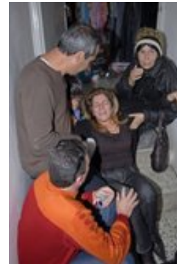
טיפול בנפגעי הלם, לאחר פגיעת רקטה בשכונת מגורים בשדרות (Sderot media center, 28 בפברואר. צילום: אלכס זגר)