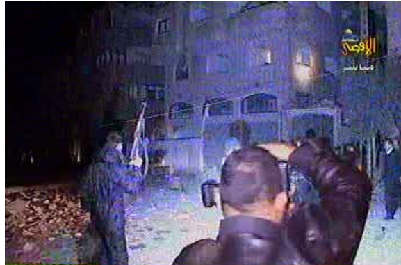
בניין משרד הפנים של ממשלת חמא"ס שהותקף ע"י ישראל (ערץ אלאקצא, 27 פברואר)

8. בעקבות מתקפת הירי של חמא"ס הגביר צה"ל את הלחץ על פעילי הטרור ברצועה וביצע שורה של תקיפות מהאוויר. אחד מיעדי התקיפה הבולטים היה בניין משרד הפנים הממוקם בשכונת אלשג'אעיה בעזה בו ממוקמים מנגנוני הביטחון של ממשלת חמא"ס. מקורות פלסטינים מדווחים כי כתוצאה מהתקיפה נהרג תינוק ונפצעו יותר מעשרים אזרחים. דובר משרד הפנים של ממשלת חמא"ס אמר כי לבניין ולכמה בניינים סמוכים לו נגרם נזק כבד (ופא, 27 בפברואר).