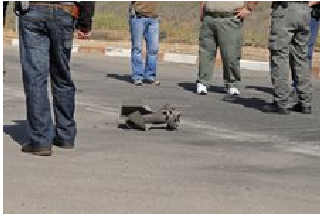
רקטה שנחתה במכללת ספיר, מאבטחו של השר לביטחון פנים אבי דיכטר נפצע באורח קל (צילום: אלכס זגר, sderot media center, 28 בפברואר)

6. מותם של חמשת פעילי חמא"ס גרר ירי מאסיבי של כ-50 רקטות לעבר יישובי הנגב המערבי. במהלך ה-27 בפברואר. 20 רקטות נוספות נורו בבוקר ה-28 בפברואר. רוב הרקטות נחתו באזור העיר שדרות ופגעו בבית מגורים, בסמוך לבית ספר ובמכוניות. אחת הרקטות שנחתה במכללת ספיר , שבפאתי שדרות, גרמה למותו של רוני יחיא ז"ל, בן, 47 סטודנט במכללה נשוי ואב לארבעה ילדים 1 . רקטה נוספת נחתה בחדר האוכל של המפעל "עוף קור" הנמצא באזור התעשייה של שדרות וגרמה לו נזק רב. רקטה נוספת שנחתה במכללת ספיר בבוקר ה-28 בפברואר פצעה מאבטח של השר לביטחון פנים אבי דיכטר שהיה בסיוור מקדים לקראת ביקור השר במקום (ynet, 28 בפברואר).