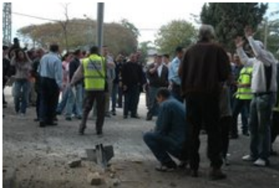
רקטה שנפלה בשכונת מגורים בשדרות (צילום: חמוטל בן שיטריט 28 בפברואר, Sderot media center).

2. בסך הכל נורו ב-27 בפברואר כ-50 רקטות מחציתם לעבר העיר שדרות. 19 רקטות נוספות נחתו בבוקר ה-28 בפברואר. אחת הרקטות נחתה במכללת ספיר והרגה את רוני יחיא ז"ל, סטודנט במכללה נשוי ואב לארבעה ילדים. חמש רקטות ארוכות טווח שוגרו לעבר אשקלון. ארבע נפילות אותרו בשטח. נפילה אחת אותרה במנחת המסוקים של בית החולים ברזילי והשנייה באזור תחנת הכוח רוטנברג (המספקת חשמל לרצועת עזה). מרבית הרקטות נורו ע"י חמא"ס.