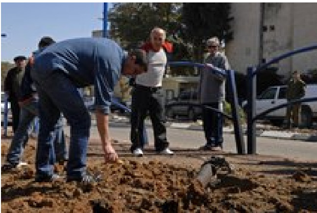
נפילת רקטה סמוך לבית הספר הרוא"ה בשדרות. מספר נפגעי חרדה פונו ע"י אנשי מד"א (28 בפברואר)