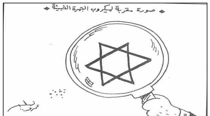
תמונה מקרוב באמצעות זכוכית מגדלת של חיידק האנתרקס מגלה מגן דויד ("אלאסבוע", מצרים, 22 אוקטובר, 2001)