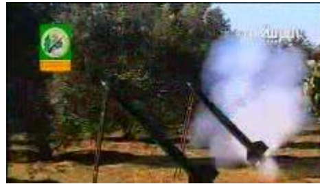
גדודי עז אלדין אלקסאם של חמא"ס מפרסמים קלטת המתעדת ירי רקטות קסאם לעבר ישראל (ערוץ אלערביה, 18 בינואר)

■ במהלך ארבעת ימי הקרב אותרו כ- 150 נפילות רקטות בשטח ישראל , שעל רובן נטלה אחריות תנועת חמא"ס . הצטרפות חמא"ס למעגל יורי הרקטות גררה עלייה חדה בהיקף הירי: בין ה- 15 ל- 18 בינואר אותרו במוצע כ- 35 נפילות מידי יום. ב- 19 בינואר, לאחר 4 ימי עימות הפסיקה חמא"ס את ירי הרקטות לעומק ישראל 2 , ומאז התייצבו הנפילות על הרמות "השגרתיות" של מספר נפילות מידי יום. מאז ה-20 בינואר שבה חמא"ס למדיניותה המוכרת של ירי רקטות ופצצות מרגמה לעבר כוחות הפועלים ברצועה ומוצבי צה"ל וישובים הנמצאים סמוך לגדר המערכת ברצועת עזה .