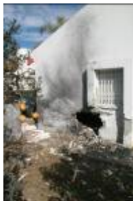
פגיעה ישירה בבתיים בעיר שדרות ב- 17 בינואר (The Israel Project, 17 בינואר)

■ מהירי המאסיבי של הרקטות נפצעו 6 אזרחים ישראלים, בניהם ילדה בת- 5 וכמה עשרות נוספים פגועי הלם וחרדה. מרבית הנפגעים הם בעיר שדרות. כמו כן, נגרם נזק רב לכמה בתים בעיר שדרות.