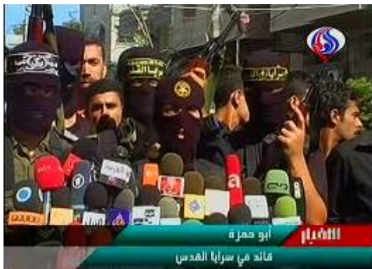
נטילת אחריות על הירי של הג'יהאד האסלאמי בפלסטין וועדות ההתנגדות העממית (טלוויזית אלעאלם, 11 בספטמבר)