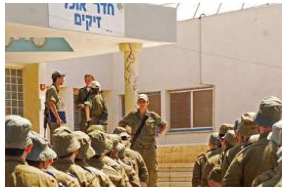
בסיס הטירונים בזיקים (דובר צה"ל, 11 בספטמבר 2007)