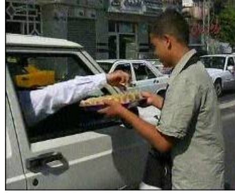
גילויי שמחה בעיר עזה בעקבות הפגיעה בחיילים בבסיס זיקים : חלוקת ממתקים לעוברים ולשבים (ראמתאן, 11 בספטמבר)