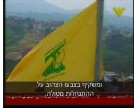
חזבאללה מניף את דגלו מול המושבה מטולה (טלוויזיית אלמנאר, 17 במאי 2007)