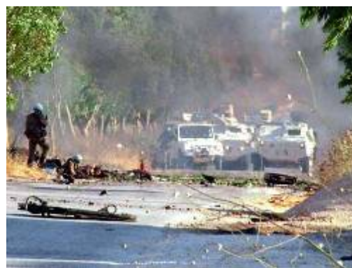
נגמ"ש יוניפי"ל שנפגע (אלספיר, 24 ביוני 2007)