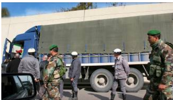
משאית אזרחית, בה הוברחו אמצעי לחימה עבור חזבאללה, שהוחרמה ע"י צבא לבנון בשכונת חזמיה בבירות (רויטרס 8 בפברואר 2007, צלם: STR News)

21. בשני מקרים עצר צבא לבנון כלי רכב שהעבירו מסוריה אמצעי לחימה עבור חזבאללה: ב-8 בפברואר 2007 נעצרה משאית ובה אמצעי לחימה בשכונת חזמיה בבירות וב-6 ביוני 2007 נעצרה משאית נוספת באזור בעל בכ. אולם היו אלו אירועים חריגים, ולא חלק ממדיניות כוללת של הממשל הלבנוני.