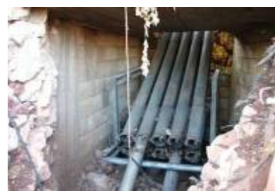
עמדות שיגור של רקטות בטבע מכוסות בשכבות של בטון