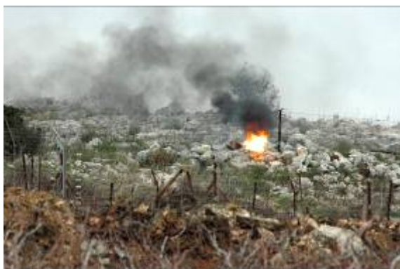
פיצוץ אחד המטענים ע"י צה"ל