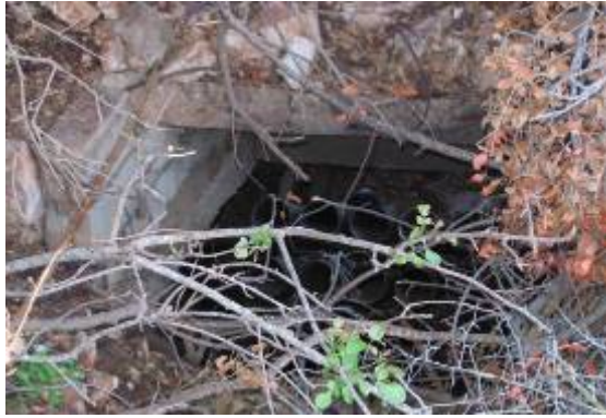
משגר רקטות מוסווה ע"י צמחייה