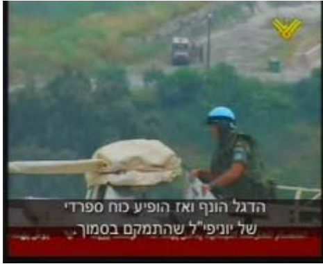
כוח יוניפי"ל שהגיע למקום הנפת הדגל (טלוויזיית אלמנאר, 17 במאי 2007)