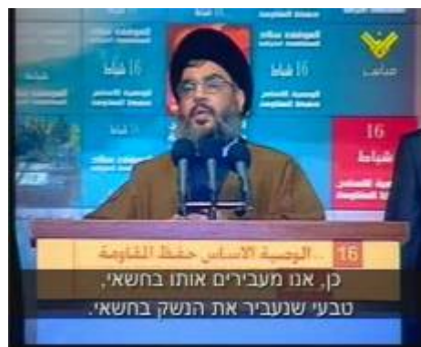
חסן נצראללה מודה בנאום מתריס כי חזבאללה מתחמש מחדש ומעביר אמצעי לחימה בחשאי לדרום לבנון (אלמנאר, 16 בפברואר 2007)