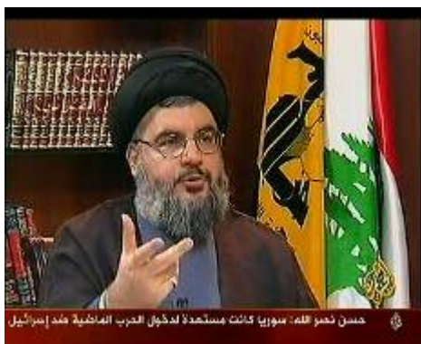
חסן נצראללה מתפאר כי כיום יש בידי חזבאללה רקטות היכולות להגיע לכל מטרה שהיא בשטח ישראל (אלג'זירה, 23 ביולי 2007)