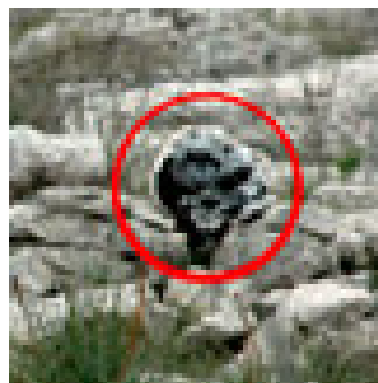
אחד המטענים דמויי סלע שנמצאו בשטח