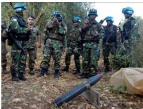
חיילי הגדוד האינדונזי של יוניפי"ל בוחנים רקטה שהתגלתה טרם שיגורה (צילום: רויטרס 17 ביוני 2007 צלם: כמאל ג'אבר)