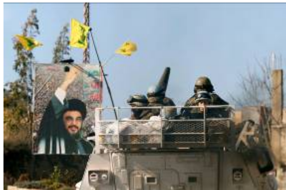
כוח יוניפי"ל (הגדוד הספרדי) עובר בסמוך לפוסטר של חסן נצראללה ולדגלי חזבאללה בכפר עדיסה שבדרום לבנון. חזבאללה מעדיף לחשוף מול המצלמות את דגליו וסמליו אך לא את פעולותיו וכלי נשקו

3. החלטת מועצת הביטחון 1701 הביאה לשינוי מהותי במציאות בדרום לבנון, כפי שהייתה מוכרת עד לפרוץ מלחמת לבנון השנייה. במרכזו של שינוי זה עומד הפיחות שחל במעמדו של חזבאללה: הארגון איבד את מעמדו כמוקד הכוח הבלעדי בדרום לבנון והוא נאלץ להשלים עם נוכחותם ופעילותם של כוחות גדולים (בהיקף חסר תקדים) של צבא לבנון ויוניפי"ל במרחב שמדרום לליטאני. צבא לבנון ויוניפי"ל מגלים נוכחות ופעלתנות בשטח, ומקיימים פעילות ביטחון שוטף (סיורים, מחסומים) שנועדה לשמור על השקט באזור ולמנוע הפרה גלויה של החלטת מועצת הביטחון 1701.