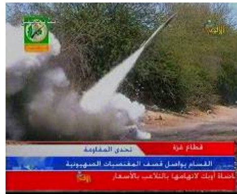
ירי רקטות לעבר ישראל ע"י החמא"ס (טלוויזית אלאקצא, 24 במאי)