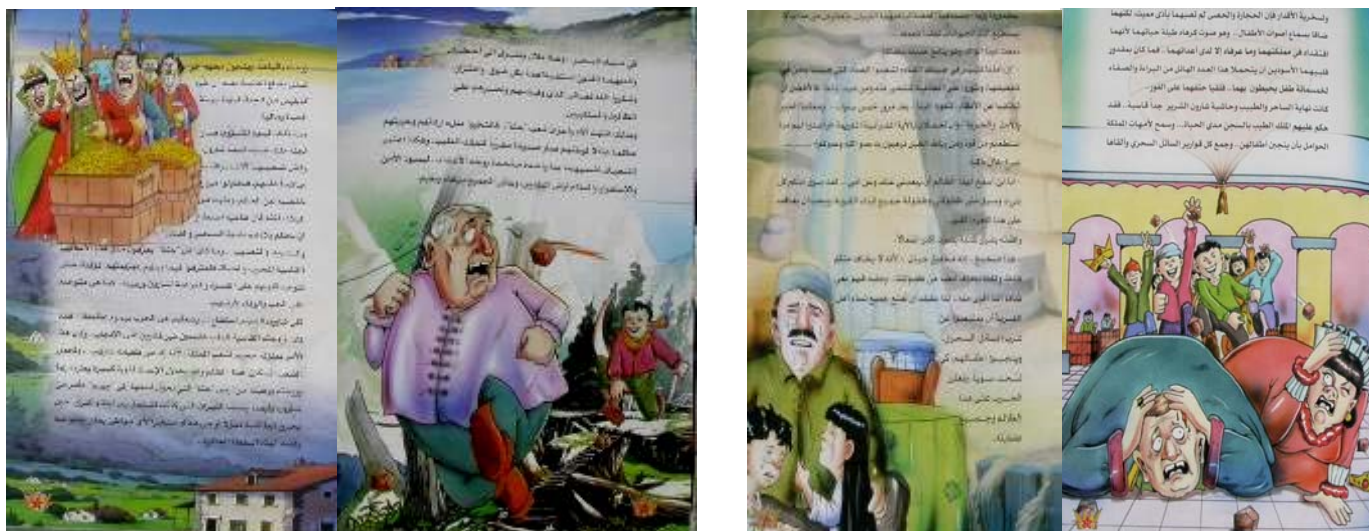
תמונות מתוך הספרון "שרון הרשע"

3. בעמוד האחרון של הספר שכותרתו "האירועים בסיפור זה" מוסברת היטב משמעות הסיפור: "האירועים הם סביב איש רשע ששמו שרון, והוא מהווה סמל לשליטי ישראל, אשר הוקמה על [בסיס] גרוש של עם [קרי: העם הפלסטיני] מאדמתו, [עם] לו ציוויליזציה משלו, ערכים משלו ותרבות אנושית. [בפלסטין השתכנו] עקורים ממדינות העולם כולו, שביניהם אין קשר מלבד הצימאון לדם, ביצוע [מעשי] טרור באמצעות רצח, הרס, חורבן והפצת שחיתות בכל רחבי העולם. באשר לגיבורי הסיפור, הרי הם ילדי פלסטין, אשר הציונות גזלה [מהם] את חלומותיהם לביטחון וליציבות..."