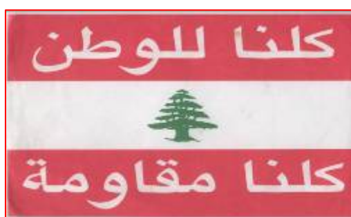
דגלון לבנון ועליו הכתובת "כולנו למען המולדת...כולנו התנגדות" [נתפס בכפר

3. בספרון מופיעות 11 דמויות של מחבלים מתאבדים של "חזבאללה" שביצעו פעולות של הקרבה עצמית למען אלה ("עמליאת אסתשהאדיה"). כל עמוד מוקדש לאחד המחבלים המתאבדים וכולל פרטים בסיסיים על הפיגועים שביצעו נגד ישראל. חלק מהמחבלים המתאבדים מופיעים בחוברת על רקע מסגד כיפת הסלע בירושלים, כל זאת בכוונה להפוך את המחבלים המתאבדים כמודל לחיקוי בקרב ילדים ובני נוער ולהציג את פעולות ההתאבדות כערך נעלה