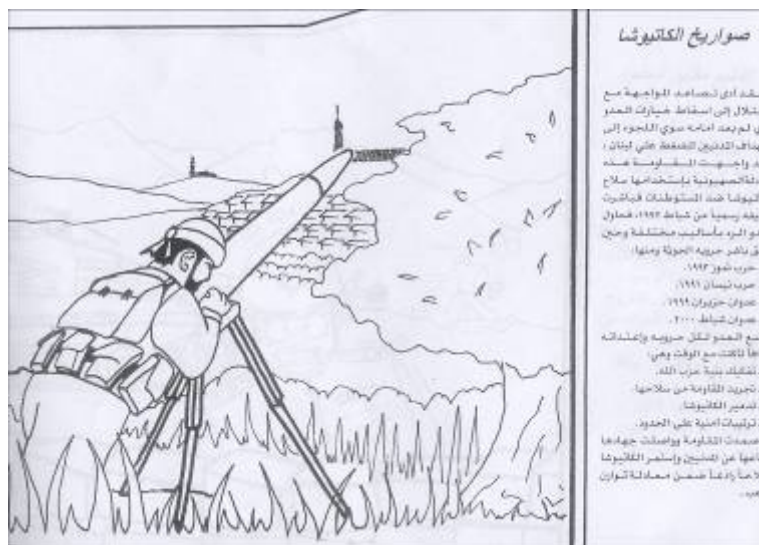
התמונה מתארת מחבל "חזבאללה" יורה טיל "קטיושה" לעבר ישראל