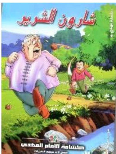
עמוד השער של הספרון "שרון הרשע", שהוצא ע"י "צופי האמאם אלמהדי" (כחלק מסדרת ספרונים המיועדים לילדים ובני נוער)