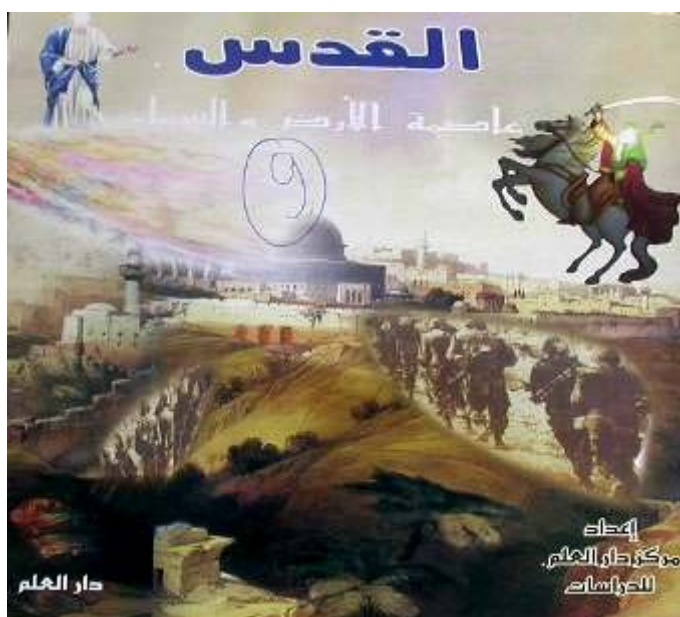
עמוד השער של הספרון "ירושלים, בירת האדמה והשמיים". האיור נועד להמחיש כי ירושלים "תשחרר" ע"י הלוחמים המוסלמיים

ספרון אנטישמי בשם "ירושלים, בירת האדמה והשמיים" מטיף לשנאה נגד העם היהודי. הספרון מטמיע את המסר לפיו ירושלים הנה ערבית-מוסלמית וליהודים ולנוצרים אין בה שום זכויות. הספרון צופה גם נקמה של המוסלמים נגד היהודים בשל "הפשעים שביצעו נגד האנושות"