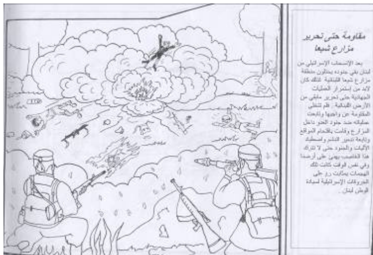
התמונה בחוברת מתארת התקפה של אנשי "חזבאללה" על אחד ממוצבי צה"ל ב"חוות שבעא" (הר דב)

"שחרור" "חוות שבעא" באמצעות פעילות צבאית ("התנגדות")