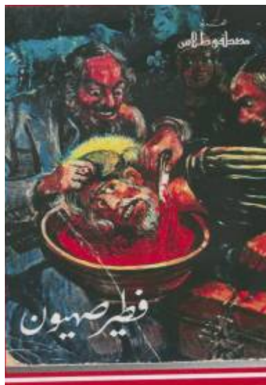
"מצת ציון", ספרו האנטישמי הפופולארי של שר ההגנה הסורי לשעבר מצטפא טלאס

7. עלילת הדם של דמשק נוצלה ע"י משטרו של חאפטי אסד להפצת הסתה אנטישמית. אחד מבכירי משטרו, שר ההגנה לשעבר מצטפא טלאס, כתב ספר בשם "מצת ציון" [קרי: מצה של פסח] העוסק בעלילת הדם של דמשק על מנת לגזור ממנה משמעויות פוליטיות אקטואליות. המסקנה שהוא מסיק הינה, שהדת היהודית כוללת "סטיות הרסניות" ו"איבה שחורה כלפי כל האנושות ונגד על הדתות", ולפיכך אסור לאף מדינה ערבית לכרות עימה הסכם שלום. ספרו האנטישמי של טלאס זוכה עד עצם היום הזה לפופולריות רבה. הוא הוצא במהדורות רבות ותורגם לשפות אירופאיות ובהן אנגלית, צרפתית ואיטלקית.