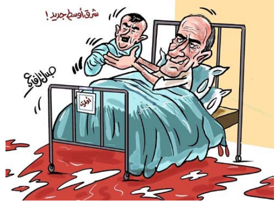
אולמרט יולד ילד בדמותו של היטלר. לידם נכתב "מזרח תיכון חדש". הרצפה מגואלת בדם (ג'לאל אלרפאעי, "אלדסתור", 26 ביולי 2006)