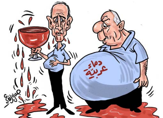
אולמרט שותה דם ולידו ראמ"מ ישראל לשעבר אריאל שרון, שעל ביטנו התפוחה נכתב "דם ערבי" (ג'לאל אלרפאעי, "אלדסתור", 8 ביולי 2006)