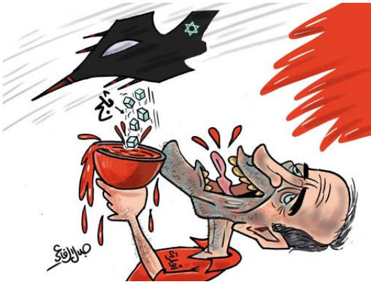
אולמרט שותה דם מגביע ומטוס ישראלי זורק לתוכו קוביות קרח (ג'לאל אלרפאעי, "אלדסתור", 15 ביוני 2006)