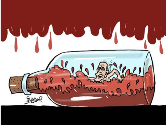
אהוד אולמרט שוחה בנהר של דם (ג'לאל אלרפאעי, "אלדסתור", 15 ביולי 2006)