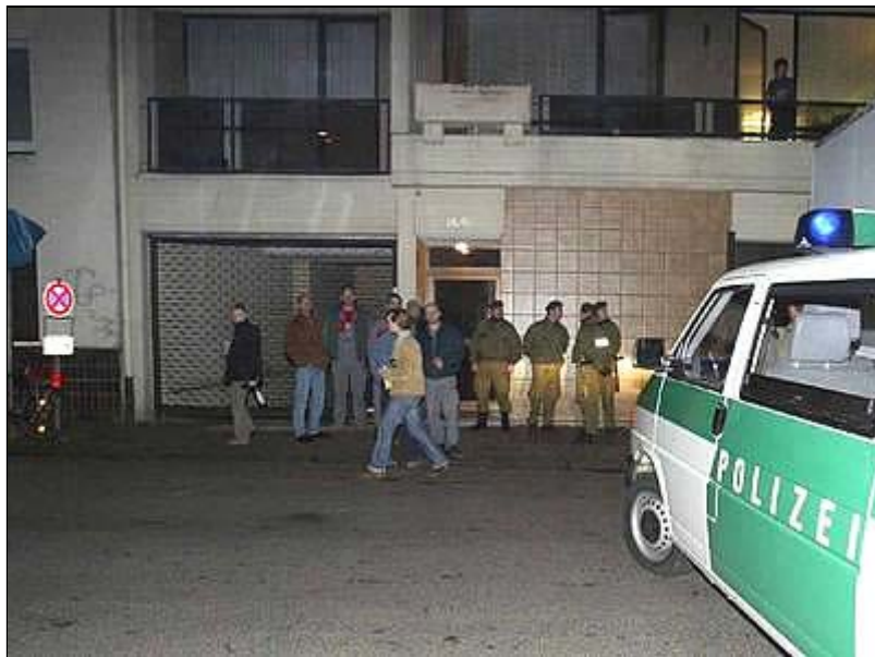
פשטת המשטרה הגרמנית על משרדי "קרן אלאקצא" בגרמניה

11. בהחלטתו קיבל בית המשפט את טיעוני המדינה וקבע כי הקרן מסייעת לקידום פעולות הטרור של ה-"חמא"ס" נגד ישראל וכי לא ניתן להפריד בין פעילותה החברתית של ה-"חמא"ס" לבין פעילותה המבצעית-טרוריסטית (נוסח ההודעה לעיתונות של בית המשפט הגרמני ב-3 בדצמבר 2004 על הפסקת פעילות הקרן, במקור ובתרגום, ראה נספח א'). מייד לאחר מכן פשטה המשטרה הגרמנית על מטה הקרן והחרימה כספים ומסמכים.