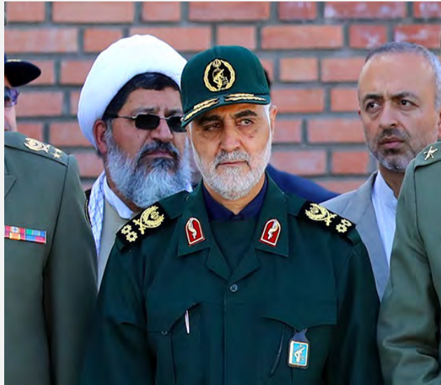
קאסם סלימאני (mizanonline.ir, 4 ביולי 2017).

וגם הקשר בין העמים באיראן ובעיראק התחזק. סלימאני התייחס גם לתמיכת איראן בפלסטינים ואמר, כי זו נמשכת חרף ניסיונות להוציא את "דגל פלסטין" מידיה של איראן (פארס, 4 ביולי 2017).