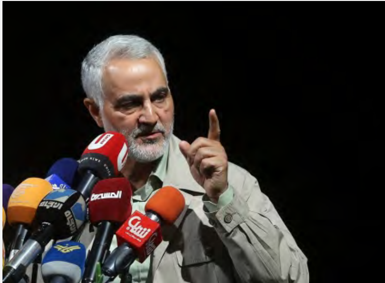
קאסם סולימאני (ספאה ניוז, 10 ביולי 2017).

■ עמאר אלחכים (Ammar al-Hakim), יו"ר המועצה האסלאמית העליונה של עיראק, ביקר בראשית יולי באיראן ונפגש עם בכירי הממשל. בפגישה עם שר החוץ מחדד ג'ואד זריף (Mohammad Javad Zarif) דן אלחכים בהתפתחויות הפוליטיות והביטחוניות בעיראק וביחסים בין שתי המדינות. הנשיא רוחאני בירך בפגישתו עם אלחכים את עיראק על שחרור העיר מוצול והדגיש את הצורך לשמר את אחדותה של עיראק לאחר הניצחון על דאעש. רוחאני ציין כי איראן מעוניינת בקשרים יציבים עם כל שכנותיה, ובמיוחד עם עיראק. במהלך ביקורו בטהראן הצהיר אלחכים, כי לאחר תבוסתו הסופית של דאעש, לא יישאר אף חייל זר ואף בסיס צבאי זר בעיראק (אירנ"א; פארס, 3-4 ביולי 2017).