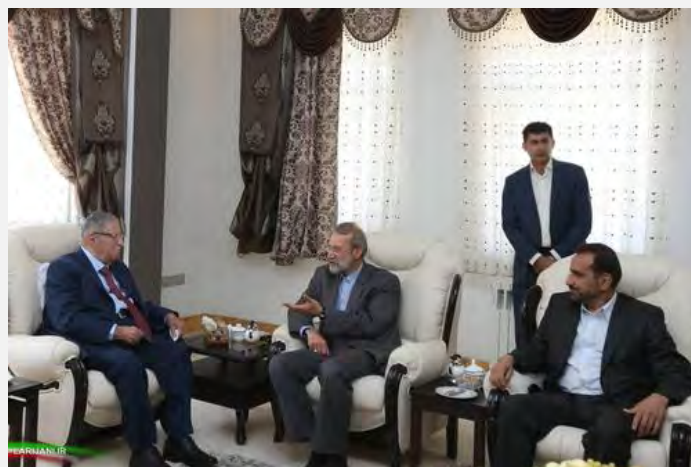
פגישת טלבאני עם יו"ר המג'לס, עלי לאריג'אני (עצרי- איראן, 12 ביולי 2017).

■ יו"ר "האיחוד הפטריוטי הכורדי" ונשיא עיראק לשעבר, ג'לאל טלבאני, הגיע לביקור בטהראן בהזמנת בכירים איראנים (תסנים, 10 ביולי 2017). ביקורו מתקיים בצל הצהרות בכירים איראנים על התנגדותם לכוונת השלטונות הכורדים בצפון עיראק לקיים משאל עם על עצמאות החבל הכורדי בחודש ספטמבר הקרוב.