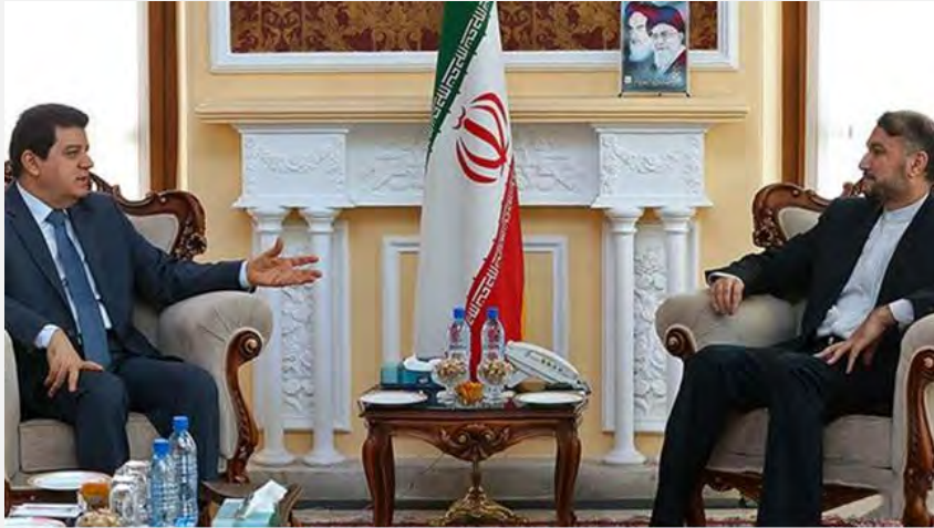
פגישת יועץ יו"ר המג'לס עם שגריר סוריה בטהראן (Press TV, 8 ביולי 2017).