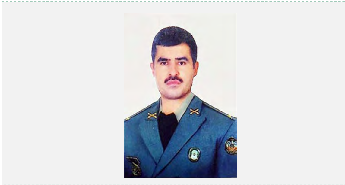
מהדי ג'ודי, קצין הצבא האיראני שנהרג בסוריה (טוויטר, 12 ביולי 2017).

■ האתר הרשמי של מנהיג איראן פרסם (5 ביולי 2017) פרטים אודות פגישת עלי ח'אמנהאי עם בכירי משמרות המהפכה, שהתקיימה שעות ספורות לאחר שיגור הטילים ממערב איראן לעבר יעדי דאעש במזרח סוריה ב-18 ביוני 2017. בסרטון וידאו, שפורסם באתר המנהיג, משבח ח'אמנהאי את משמרות המהפכה על פעולתם "המצוינת" ומעודד את המפקדים הבכירים להמשיך במלוא יכולותיהם בפיתוח תוכנית הטילים של איראן לנוכח "רגישות האויב" לשימוש בטילים.