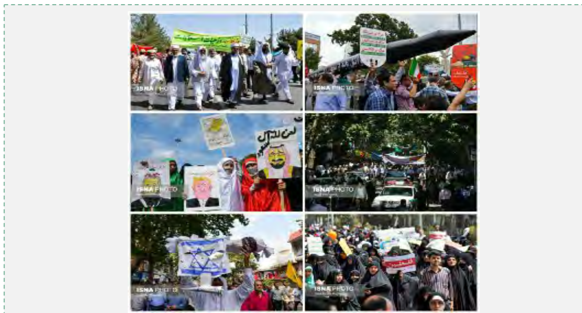
תהלוכות יום ירושלים בטהראן (איסנ"א, 23 ביוני 2017).

■ ערב יום ירושלים אמר המנהיג העליון, עלי ח'אמנהאי, כי משמעות יום ירושלים אינה רק הגנה על עם מדוכא, שגורש מביתו וממולדתו. ההגנה על פלסטין כיום היא הגנה על אמת הגדולה מסוגיית פלסטין. המאבק כנגד "המשטר הציוני" הוא המאבק נגד ההתנשאות (כינוי למערב) והסדר ההגמוני, אמר ח'אמנהאי (פארס, 21 ביוני 2017).