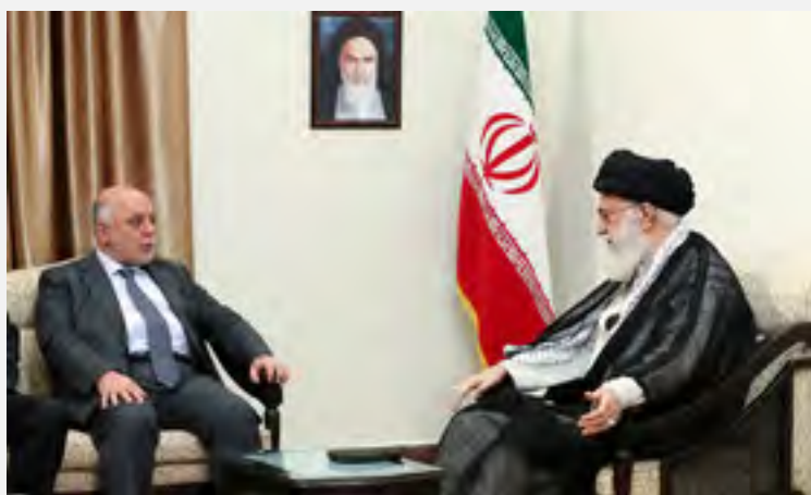
פגישת ח'אמנהאי עם אל-עבאדי (אתר המנהיג, 21 ביוני 2017).

עלי ח'אמנהאי, שלא לסמוך על האמריקאים מאחר שהם מתנגדים לעצמאותה, לזהותה ולאחדותה של עיראק. הוא ציין, כי אסור לספק בידי האמריקאים הזדמנות להעמיק את חדירתם לעיראק ויש למנוע כניסתם של כוחות אמריקאים לעיראק בכיסוי של מדריכים. האמריקאים אינם מעוניינים, לדבריו, בחיסול דאעש, שהוקם ונתמך על-ידם, ובסילוקו מעיראק. עוד אמר ח'אמנהאי, כי הגעתן של המיליציות השיעיות העיראקיות לגבול עיראק-סוריה היא משמעותית ואסטרטגית. ח'אמנהאי הדגיש את הצורך בשמירת לכידותה הטריטוריאלית של עיראק ואמר כי איראן מתנגדת לעריכת משאל עם על עצמאות החבל הכורדי בצפון עיראק (אתר המנהיג העליון, 20 ביוני 2017).