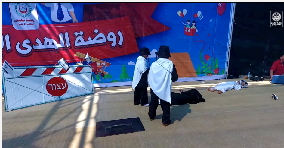
ילדי הגן מדמים אירוע בו שני יהודים חרדים תוקפים והורגים פלסטיני ובתו (יוטיוב, 29 במאי 2017)

החרדים. לאחר מכן בעוד הגופות שרועות על הבמה ביצעו הילדים מגוון תרגילי נשק. לבסוף התפללו והצטלמו תמונת סלפי (יוטיוב, 29 במאי 2017).