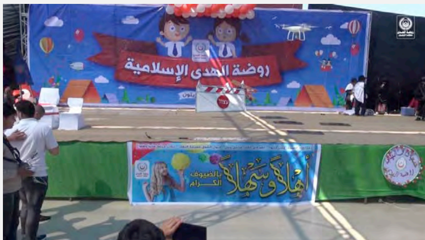
רחפן צילום, שבו נעשה שימוש במהלך המיזג (יוטיוב, 29 במאי 2017)