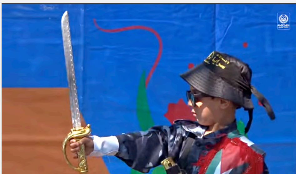
הילד שפתח את טקס הסיום בגן הילדים של דאר אלהדא, כשבידו חרב שלופה ועל ראשו כובע של "פלוגת ירושלים" (יוטיוב, 29 במאי 2017)

5. לאחר מכן, עלו לבמה ארבעה ילדים לבושים מדים צבאיים ומדי הסוואה עליהם לוגו של פלוגות ירושלים. הילדים נשאו תמונות של רמז'אן שלח, מזכ"ל הארגון, ופתחי שקאקי, מייסדו ומי שעמד בראשו, עד שנהרג באוקטובר 1995 בהתנקשות בחייו במלטה. ברקע הושמעו הקלטות בהן נושאים השניים דברים. בדברים שנשא פתחי שקאקי (ככל הנראה אחד מנאומיו) הוא שיבח את תפקידם של לוחמי הג'האד (המג'אהדין) בפלסטין ובלבנון המערערים את יציבותה של ישראל ומונעים את חדירתה לאזור. רמז'אן שלח אמר, כי פלסטין כולה מן הנהר ועד הים היא אדמה ערבית אסלאמית ואין לוותר על פיסת קרקע מאדמת פלסטין ולא על גרגיר מירושלים.