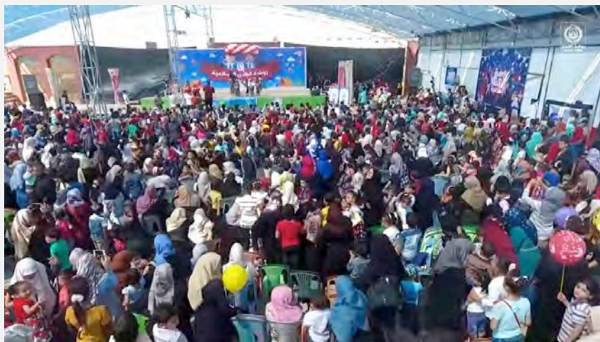
ההורים וקהל הצופים הגדול בטקס הסיום של גן הילדים אלהדא האסלאמי בשכונת זיתון בעזה (יוטיוב, 29 במאי 2017)