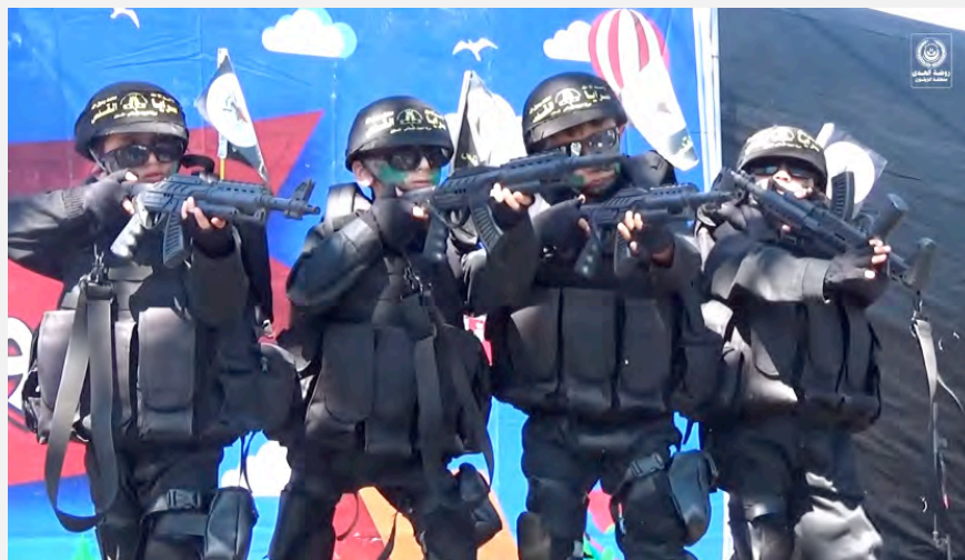
מסיבת סיום של ילדי הגן. על רקע של ציורי ילדים, נראים ילדים לבושי מדים מצוידים ברובים, סכינים ואקדחים מבעים תרגילי ראווה המדמים הריגת יהודים חרדים (יוטיוב, 29 במאי 2017)

4. המיצג בטקס הסיום החל בנאום, שנשא נער אשר דיבר בשבחי ירושלים. לאחר שסיים את דבריו עלה לבמה ילד לבוש מדים וחובש על ראשו כובע עליו לוגו של פלוגות ירושלים, הזרוע הצבאית של הג'האד האסלאמי בפלסטין. הנער שנכנס לבמה עם דגל פלסטין ודגל שחור של הג'האד האסלאמי, החזיק בידו חרב שלופה ופתח את האירוע. במקום בו התקיים הטקס נכח קהל רב.