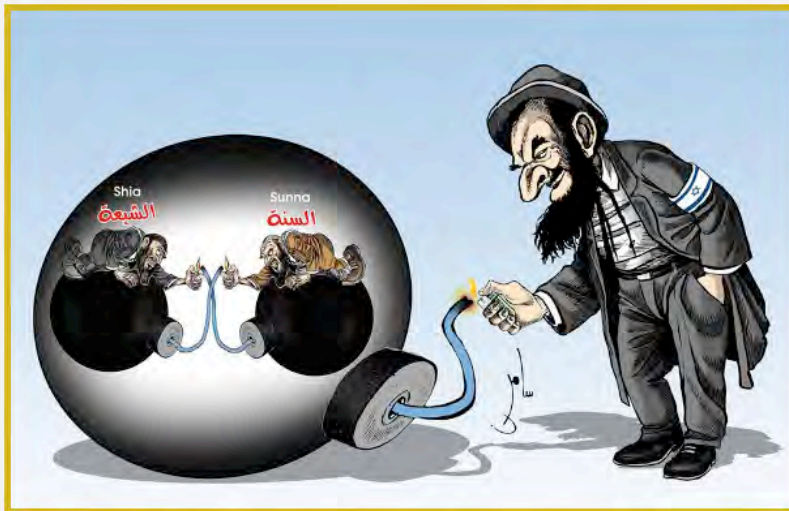
דמוניזציה של ישראל: קריקטורה המעבירה את המסר, כי ישראל מלבה את הסכסוך בין הסונים לשיעים (אתר נציבות ההסברה של פתח, 18 באוקטובר 2016).

13. אמצעי חשוב להטמעת אתוס זה בקרב הדור הצעיר משמשים ספרי הלימוד הפלסטינים 8 . לכך ניתן להוסיף החינוך הבלתי פורמאלי המתבצע בבתי הספר 9 . התקשורת הפלסטינית הכתובה והאלקטרונית, ועוד יותר הרשתות החברתיות, עוסקים גם הם בטיפוח אתוס זה ולא פעם הם מוסיפים שמן למדורה, ומתדלקים את השנאה כלפי ישראל. אונר"א, המפעילה בבתי ספר במחנות