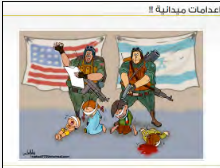
דמוניזציה של ישראל: קריקטורה, שהתפרסמה באתר נציבות ההסברה של פתח, המאשימה את ישראל וארה"ב בהוצאה להורג של ילדים פלסטינים (אתר אתר נציבות ההסברה של פתח, 12 בדצמבר 2015).