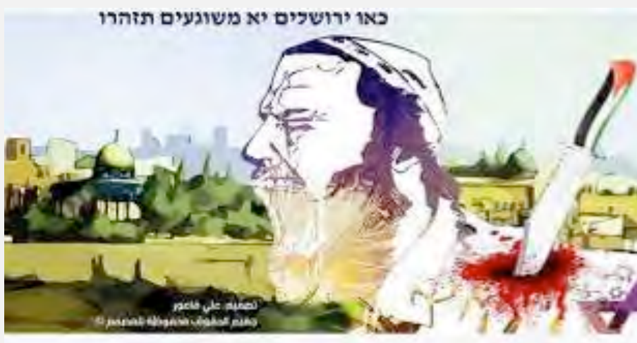
עידוד פיגועי דקירה: כרזה של פתח הקוראת לדקירת ישראלים בירושלים (חשבון הטוויטר של משרד הגיוס והארגון של פתח, 4 באוקטובר 2015).

1) הרשות ופתח נמנעים מלגנות פיגועים נגד ישראל, גם כאלו המתבצעים בתוך שטח ישראל, גם כאלו שגרמו למותם של אזרחים, גם כאלו שלא ניתן להגדירם כ"התנגדות עממית". אולם בניגוד לחמאס נמנעת הרשות הפלסטינית מלקרוא במפורש להריגת ישראלים, לפחות לא בכלי התקשורת ה"מסורתיים" (עיתונים, רדיו, טלוויזיה). לעומת זאת, ברשתות החברתיות ההסתה של פתח לטרור ולאלימות הינה בוטה וישירה יותר.