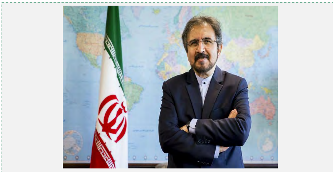
דובר משרד החוץ האיראני, בהראם קאסמי, ( איסנ"א, 14 במאי, 2017 )