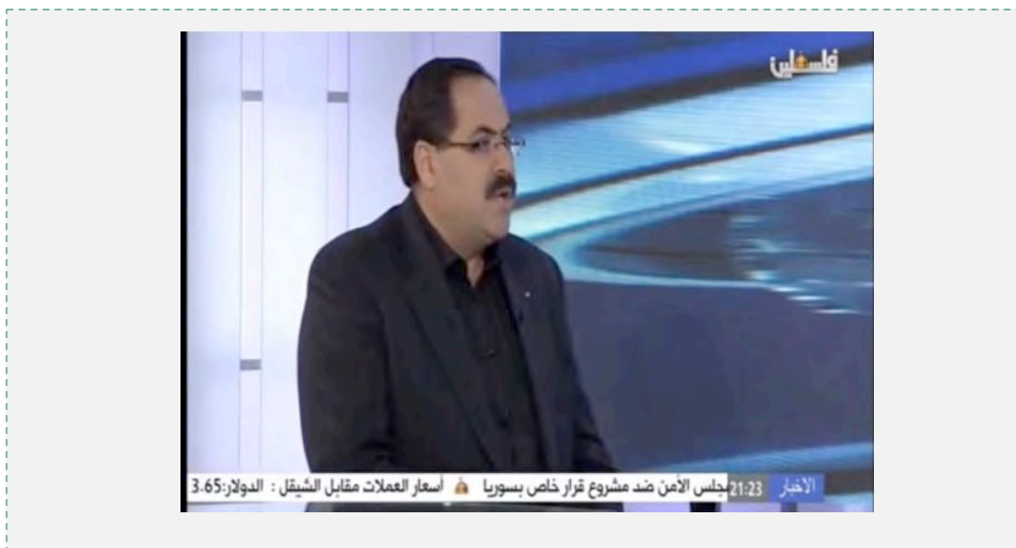
צברי צידם, שר החינוך הפלסטיני, מתראיין לטלוויזיה הפלסטינית בעקבות החלטת משרדו להשעות את הקשרים עם אונר"א (יוטיוב, 13 באפריל 2017)

7. צברי צידם, שר החינוך הפלסטיני, הודיע בטלוויזיה הפלסטינית, כי עד שאונר"א לא תודיע על חזרה מכוונתה, לא יחודשו הקשרים בין הצדדים. צברי צידם קרא ל"אנתיפאדה בדרכי שלום" (בערבית: אנתפאצ'ה סלמיה ) נגד ארגון אונר"א ופנה לעובדי אונר"א הפלסטינים ול"וועדת העממיות" במחנות הפליטים "להתקומם" נגד כוונת אונר"א, ב"דרכים מתורבתות" ובאופן שקט (מתוך סרטון, שהועלה ליוטיוב ב-13 באפריל 2017, ע"י פלסטיני בשם פתחי אבו סעדה מחאן יונס. בסרטון הופיע קטע מראיון שהעניק צברי צידם, שר החינוך הפלסטיני, לטלוויזיה הפלסטינית אודות השעיית הקשרים עם אונר"א, יוטיוב, 13 באפריל 2017).