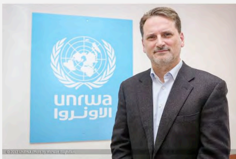
פייר קרהנבול, הנציב הכללי של אונר"א (חשבון הטוויטר של פייר קרהנבול, 8 באפריל 2017).

8. נראה כי הלחצים המשולבים, של חמאס ושר החינוך הפלסטיני. נשאו פרי והביאו ל"כניעת" אונר"א. ב-17 באפריל 2017 נפגש ראמי חמדאללה, עם פייר קרהנבול הנציב הכללי של אונר"א. הפגישה התקיימה בלשכתו של חמדאללה בראמאללה. בהודעת אונר"א נאמר, כי השניים דנו בנושאים שונים הקשורים במצבם של הפליטים הפלסטינים ובין השאר הועלתה סוגיית תוכנית הלימודים הנלמדת בבתי הספר של אונר"א. על פי ההודעה סיכמו שני הצדדים, כי השיחה ביניהם הייתה "חשובה מאוד", והיא שיקפה את השותפות המוצקה שביניהם (אתר אונר"א, 17 באפריל 2017).