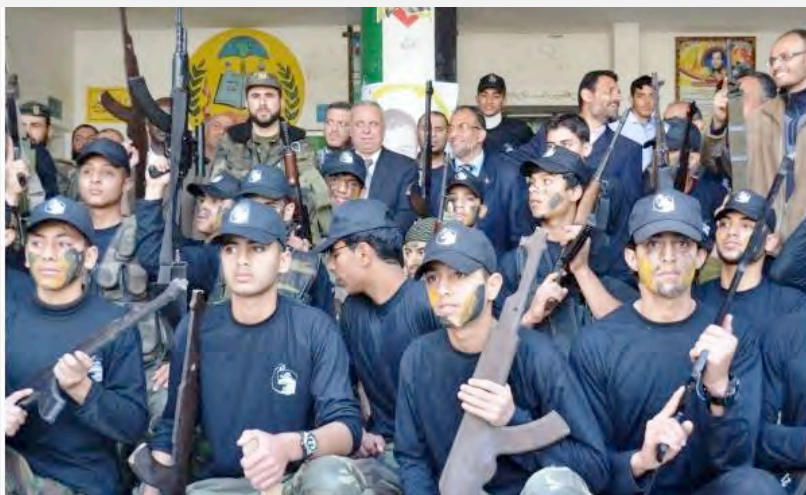
חניכי פרוייקט אלפתוה ב"בית הספר" על שם ג'מאל עבד אלנאצר, שבמזרח העיר עזה אוחזים ברובים אמיתיים וברובי דמה בעת תצלום משותף עם בכירים במשרד החינוך ובמשרד הפנים של ממשל חמאס ברצועה (דניא אלוטן, 4 באפריל 2013).