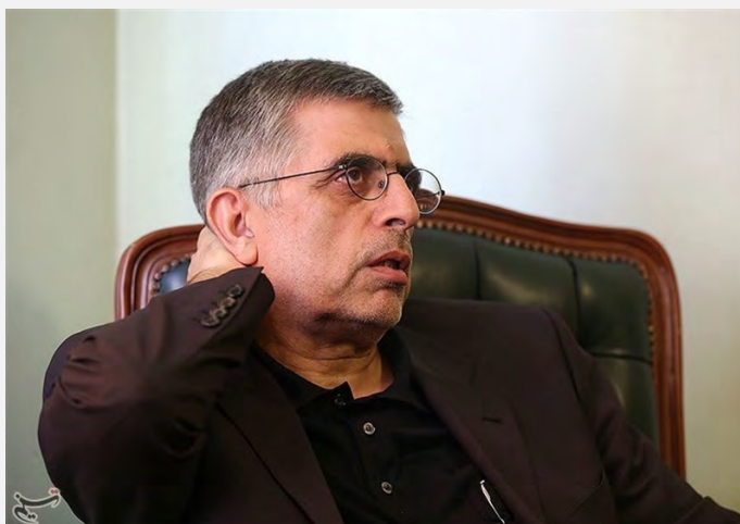
ראש עיריית טהראן לשעבר, ע'לאם-חסין כרבאסצ'י (תסנים, 1 במאי 2017)

מעורבות צבאית וכי ניתן לפתור את המשבר במדינה באמצעות דיפלומטיה. הוא ציין, כי אין מחלוקת בנוגע לצורך להשכין שלום בסוריה, בלבנון ובתימן, ולחזק את השיעים במדינות אלה, אך קיימות דרכים אחרות לעשות זאת מלבד העברת כספים, מכירת נשק ומעשי הרג (תסנים, 1 במאי 2017). דבריו זכו לתגובות חריפות מצד תומכי המשטר, שטענו, כי הצהרותיו משרתות את אויבי איראן. התובע הכללי באצפהאן הודיע כי בכוונת הרשות השופטת להעמיד את כרבאסצ'י לדין בעקבות דבריו.