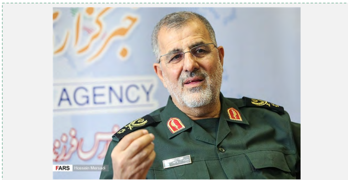
מפקד כוחות היבשה של משה"מ, מחמד פאכפור ( פארס, 2 במאי 2017)

■ ג'ואד תרכ-אבאדי (Javad Tork Abadi), שגריר איראן החדש בדמשק, החל בסוף אפריל 2017 בתפקידו. ב-26 באפריל 2017 הגיש תרכ-אבאדי את כתב אמנתו לשר החוץ הסורי, וליד אלמעלם, וב-2 במאי 2017 לנשיא אסד. תרכ-אבאדי, ששימש בעבר כשגריר איראן בסודאן, בבחריין ובניגריה וכמיופה הכוח של איראן בכווית, החליף את מחמד רזא ראוף שיבאני ( Mohammad Reza Raouf Sheybani), שסיים את תפקידו כשגריר באוקטובר 2016 (מהר, 26 באפריל 2017). העיכוב במינוי שגריר חדש בדמשק עורר בחודשים האחרונים ביקורת חריפה במערכת הפוליטית האיראנית, במיוחד על רקע המערכה הנמשכת בסוריה במעורבות איראן. בדצמבר 2016 פנו כמה חברי מגלס לשר החוץ, מחמד-ג'ואד זריף, בדרישה למנות בדחיפות שגריר חדש בדמשק.