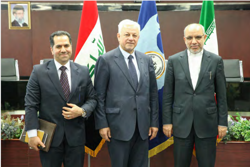
שגריר עיראק בטהראן (במרכז) עם מנכ"ל בנק ספה (מימין) ( www.banksepah.ir , 27 בפברואר 2017).

■ רשות השידור האיראנית הקימה תחנת רדיו בשם קול בחרין במטרה לייצא את "מסר המהפכה" לממלכה על רקע המחאה הנמשכת מצד השיעים נגד השלטונות. הרדיו ישדר חדשות, פרשנויות בנושאים פוליטיים וחברתיים ויספק מידע על העימותים בין השלטונות לאופוזיציה. הרדיו יפעל גם באמצעות האינטרנט, הרשתות החברתיות ואפליקציה בטלפונים סלולאריים (פארס, 4 במרץ 2017).