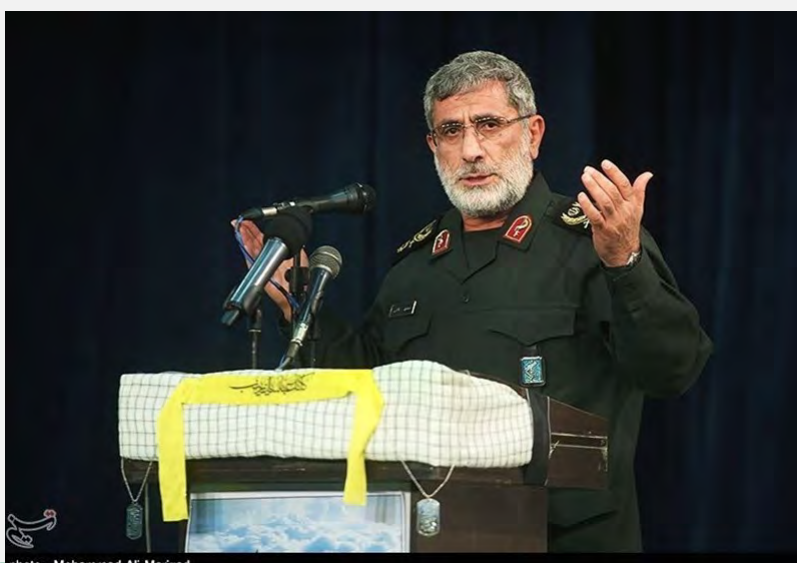
אסמאעיל קאא'ני (תסנים ניוז, 1 במרץ 2017).

■ אסמאעיל קאא'ני ( Esmail Qaani), סגן מפקד כוחות קדס של משמרות המהפכה, שיבח בטקס לזכר לוחמי חטיבת פאטמיון האפגאנית, שנהרגו בסוריה, את לוחמי החטיבה הפועלת בחסות משמרות המהפכה. הוא ציין, כי לוחמי החטיבה אינם מכירים בגבולות ופועלים בכל מקום נדרש כדי להגן על ערכי האסלאם. הוא אמר, כי הם נלחמים בסוריה, אך השפעת לחימתם חורגת מעבר לסוריה והם מבטאים את תרבות ההתנגדות כנגד המערב. סוריה וחלב הם רק חלק ממטרתם של הלוחמים והיעד המרכזי שלהם הוא כינון ממשלה עולמית בהנהגת האמאם הנעלם. קאא'ני הוסיף, כי האמריקאים והישראלים מתאבלים כיום לנוכח פריחת תרבות ההתנגדות באזור וכי ארה"ב לא הייתה מסכימה למשא ומתן על עתיד סוריה אלמלא עוצמתם של לוחמי הפאטמיון בשדה הקרב (תסנים, 1 במרץ 2017).