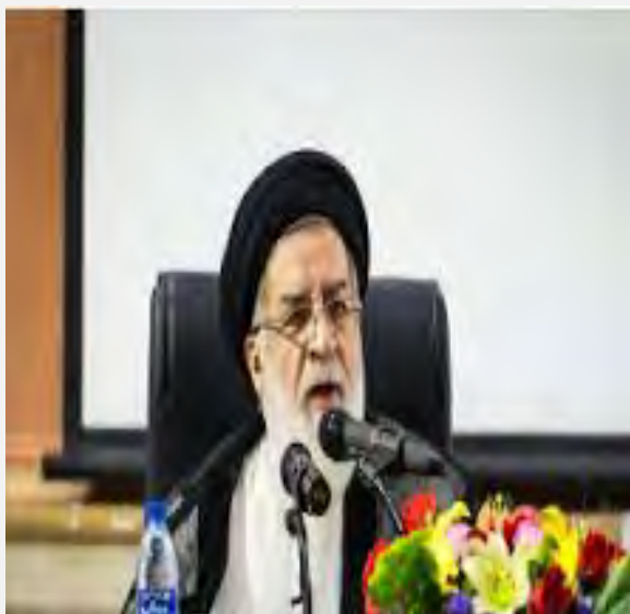
יו"ר קרן השהיד, סיד מחמד עלי שהידי (עצרי- איראן, 6 במרץ 2017).

■ חסן רוחאני, נשיא איראן, נפגש ב-1 במרץ 2017 עם רג'פ טאיפ ארדואן, נשיא תורכיה, בשולי כינוס ועידת הפסגה של הארגון לשיתוף פעולה כלכלי (ECO) בפקיסטאן. בפגישה אמר רוחאני לארדואן, כי איראן מתנגדת לכל פגיעה בלכידות הטריטוריאלית של מדינות האזור, ובראשן סוריה ועיראק. שני הנשיאים דנו בפגישתם גם ביחסים הבילטרליים בין שתי המדינות (תסנים, 1 במרץ 2017). פגישת הנשיאים התקיימה בצל מתיחות בין שתי המדינות, לאחר שהנשיא ארדואן ושר החוץ התורכי, מבלוט צ'בושולו, האשימו לאחרונה את איראן בחתרנות אזורית. בעקבות הצהרות אלה זימן משרד החוץ האיראני בסוף פברואר 2017 את שגריר תורכיה בטהראן לשיחת בירור ודובר משרד החוץ האיראני הצהיר, כי יש גבול לסבלנותה של איראן ביחס לעמדות תורכיה.