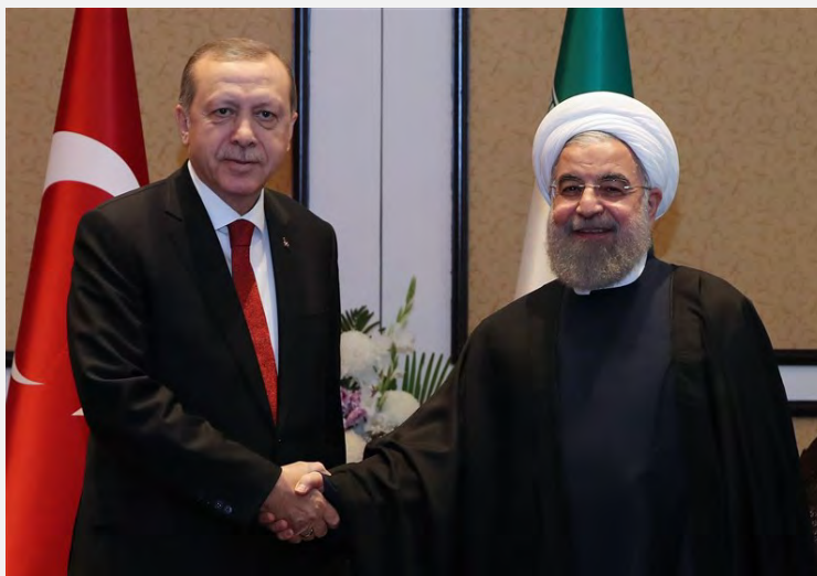
פגישת רוחאני-ארדואן (תסנים ניז, 1 במרץ 2017).

■ חסן רוחאני, נשיא איראן, נפגש ב-1 במרץ 2017 עם רג'פ טאיפ ארדואן, נשיא תורכיה, בשולי כינוס ועידת הפסגה של הארגון לשיתוף פעולה כלכלי (ECO) בפקיסטאן. בפגישה אמר רוחאני לארדואן, כי איראן מתנגדת לכל פגיעה בלכידות הטריטוריאלית של מדינות האזור, ובראשן סוריה ועיראק. שני הנשיאים דנו בפגישתם גם ביחסים הבילטרליים בין שתי המדינות (תסנים, 1 במרץ 2017). פגישת הנשיאים התקיימה בצל מתיחות בין שתי המדינות, לאחר שהנשיא ארדואן ושר החוץ התורכי, מבלוט צ'בושולו, האשימו לאחרונה את איראן בחתרנות אזורית. בעקבות הצהרות אלה זימן משרד החוץ האיראני בסוף פברואר 2017 את שגריר תורכיה בטהראן לשיחת בירור ודובר משרד החוץ האיראני הצהיר, כי יש גבול לסבלנותה של איראן ביחס לעמדות תורכיה.