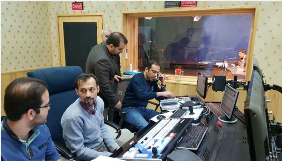
רדיו קול בחרין (אבנ"א ניז, 28 בפברואר 2017).

■ רשות השידור האיראנית הקימה תחנת רדיו בשם קול בחרין במטרה לייצא את "מסר המהפכה" לממלכה על רקע המחאה הנמשכת מצד השיעים נגד השלטונות. הרדיו ישדר חדשות, פרשנויות בנושאים פוליטיים וחברתיים ויספק מידע על העימותים בין השלטונות לאופוזיציה. הרדיו יפעל גם באמצעות האינטרנט, הרשתות החברתיות ואפליקציה בטלפונים סלולאריים (פארס, 4 במרץ 2017).