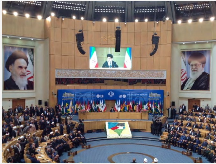
ח'אמנהאי נושא נאום בפני הועידה (תסנים ניז, 21 בפברואר 2017).

■ בנאומיהם תקפו ראשי המשטר האיראני את ישראל ("הגידול הסרטני") ומדיניותה כלפי הפלסטינים, קראו להמשך "ההתנגדות" עד לשחרורה המלא של פלסטין, הדגישו את מחויבות איראן להמשך התמיכה בפלסטינים ובמאבקם, מתחו ביקורת על נכונותן של כמה ממדינות האזור לקיים קשרים עם ישראל והזהירו מפני הסטת תשומת לב העולם המוסלמי והערבי מהבעיה הפלסטינית למשברים הפנימיים בפניהם ניצב האזור. בנאומו בפתח הועידה אמר ח'אמנהאי, המנהיג העליון כי פלסטין צריכה לשמש ציר האחדות עבור המדינות המוסלמיות חרף חילוקי הדעות הפנימיים בעולם המוסלמי. הוא ציין, כי דרך "ההתנגדות" בלמה את התפשטותו של "המשטר הציוני" וסיכלה את תוכניתו להשתלט על האזור (תסנים, 21 בפברואר 2017).