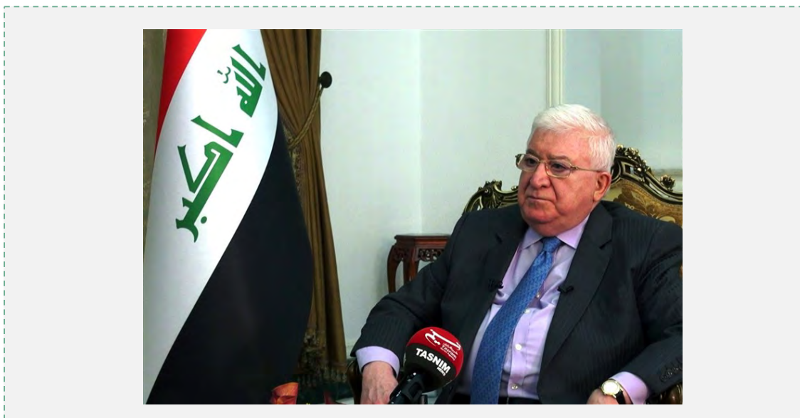
נשיא עיראק בריאיון ל"תסנים ניוז", 12 בפברואר 2017.

■ פואד מעצום (Fuad Masum), נשיא עיראק, הגן בריאיון לסוכנות הידיעות האיראנית תסנים ניוז, על נוכחותו בעיראק של קאסם סלימאני, מפקד כוח קדס של משמרות המהפכה. מעצום טען, כי נוכחות סלימאני בעיראק היא "טבעית" ומתקיימת במסגרת נוכחותם של יועצים צבאיים זרים אחרים בעיראק. הוא ציין, כי גם יועצים מארה"ב, צרפת, בריטניה ומדינות אירופאיות אחרות נמצאים בעיראק ולא ניתן לשלול מאיראן את הזכות לשלוח יועצים צבאיים לעיראק. עוד אמר מעצום, כי הקשרים ההיסטוריים בין איראן לעיראק משרתים את האינטרסים של עיראק וכי לעיראק חשוב לקיים יחסים אסטרטגיים עם איראן ולקדם את קשריה עימה משום שהתמיכה האיראנית בעיראק בתחומים שונים, ובהם אספקת נשק וייעוץ צבאי, משרתת את האינטרסים העיראקים (תסנים ניוז, 12 בפברואר 2017).