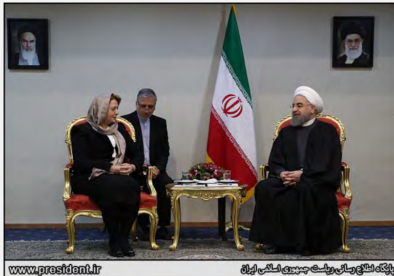
פגישת רוחאני-עבאס (אתר הנשיא, 22 בפברואר 2017).