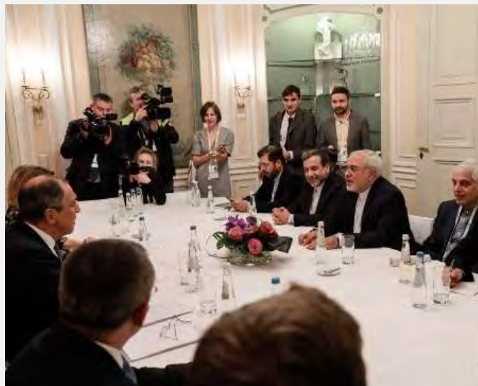
פגישת זריף – לברוב בשולי ועידת מינכן (אירנ"א, 18 בפברואר 2017).

■ מחדד ג'ואד זריף (Mohammad Javad Zarif), שר החוץ האיראני, נפגש במסגרת ועידת הביטחון שהתקיימה במינכן עם שליח האו"ם לסוריה, סטפן דה מיסטורה. כמו כן נפגש שר החוץ עם עמיתו הרוסי, סרגיי לברוב. ודן עימו בהתפתחויות בסוריה וביחסים בין שתי המדינות (אירנ"א, 18 בפברואר 2017).