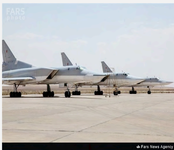
מפציצים רוסיים בשדה תעופה המדאן שבאיראן (פארס, 16 באוגוסט 2016).

1. בשנה האחרונה התרחב שיתוף הפעולה בין איראן לרוסיה, בעיקר סביב המערכה הנמשכת בסוריה. שיאו של שיתוף פעולה זה בשימוש, שעשו מטוסי קרב רוסיים באוגוסט 2016 בשדה התעופה הצבאי בעיר המדאן שבאיראן לתקיפת יעדים בסוריה. השימוש פסק אומנם באופן זמני על רקע ביקורת פנימית באיראן נגד ההיתר שניתן לצבא זר לעשות שימוש בבסיס צבאי איראני, אך בכירים איראנים כבר הודיעו, כי איראן עשויה לאפשר שימוש מחודש בבסיס בהתאם לצרכים המבצעיים.