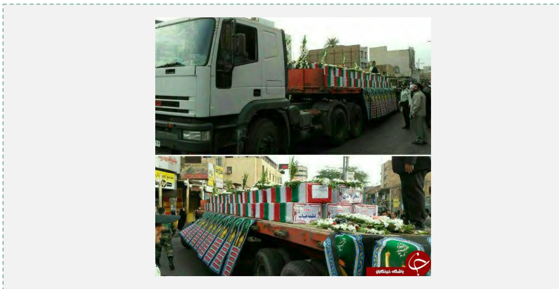
הלווית הרוגי חילה בעיר אהואז (yjc.ir, 30 בנובמבר 2016).

■ בכירים איראנים גינו בחריפות את מתקפת הטרור. הנשיא רוחאני קרא לממשלת עיראק להגביר את המאבק נגד הטרוריסטים והדגיש את מחויבות איראן להמשך המאבק בטרור (תסנים, 26 בנובמבר 2016). חסין סלאמי (Hossein Salami), סגן מפקד משמרות המהפכה, אמר כי הפיגוע הוא תגובה לתבוסותיהם של הטרוריסטים בעיראק וכי התגובה למתקפת הטרור תבוא בשדה הקרב (מהר, 27 בנובמבר 2016).