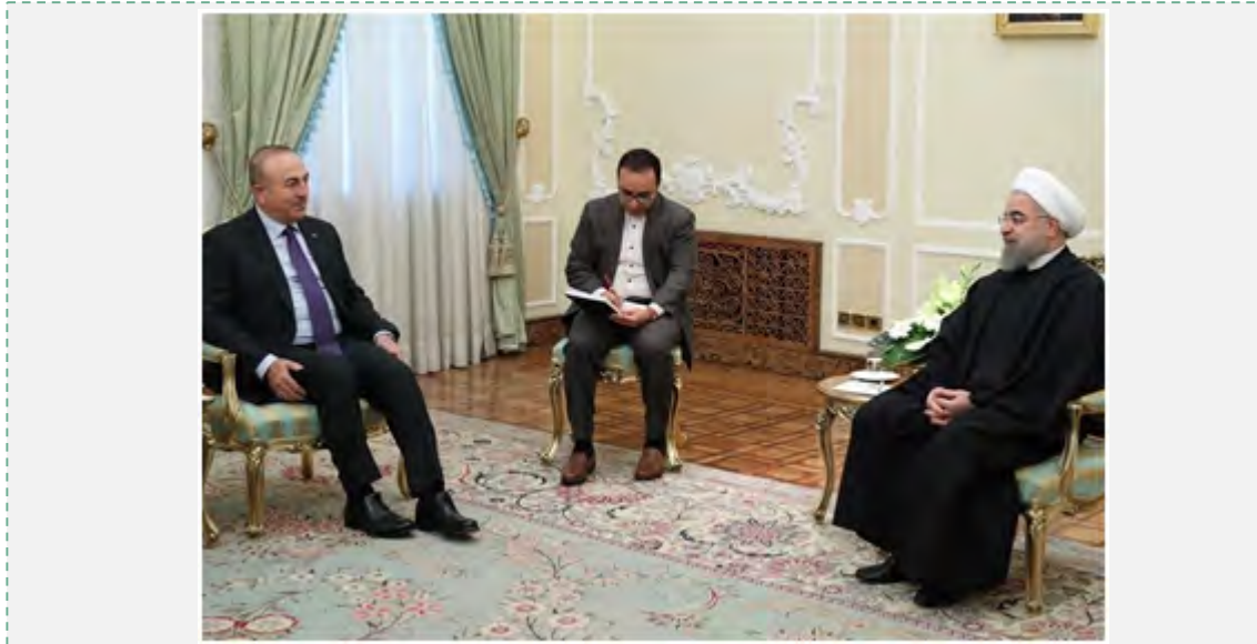
פגישת רוחאני – צ'בושולו (תסנים, 26 בנובמבר 2016).

■ מחמד-עלי ג'עפרי (Mohammad Ali Jafari), מפקד משמרות המהפכה, אמר, כי המיליציות השיעיות הפועלות בעיראק אינן זקוקות ללוחמים איראנים במערכה המתנהלת במוצול. הוא ציין, כי איראן שלחה מספר מוגבל של יועצים לעיראק, אך כוחות איראנים אינם נוטלים חלק בלחימה במוצול. בנאום לרגל שבוע הבסיג' הצדיק ג'עפרי את מעורבות איראן במדינות האזור ואמר, כי הבסיס של המהפכה האסלאמית הוא הגנה על המוסלמים והמדוכאים. לפיכך, טועים אלה הטוענים, כי אין סיבה שאיראן תפעל בלבנון, בסוריה או בתימן ותתמקד בענייניה הפנימיים בלבד (תסנים; פארס, 24 בנובמבר 2016).