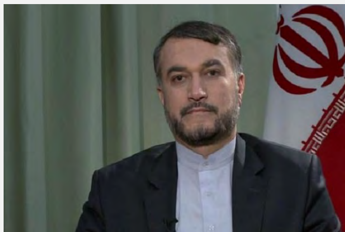
חסין-אמיר עבדאללהיאן (מהר, 28 בנובמבר 2016).

■ חסין-אמיר עבדאללהיאן (Hossein Amir Abdollahian), יועצו לעניינים בינלאומיים של יו"ר המג'לס, פרסם איגרת ברכה להנהגה הסורית, לעם הסורי ולצבא סוריה בעקבות "הניצחונות האחרונים שהושגו באזור חלב". לנוכח השתלטות כוחות צבא סוריה בסיוע אווירי רוסי על שכונות נוספות בצפון-מזרח חלב ציין עבדאללהיאן, כי חלב נמצאת על סף שחרור משליטת הקבוצות הטרוריסטיות וכי איראן תמשיך להגיש סיוע בייעוץ לממשלות ולעמים בסוריה ובעיראק (מהר, 28 בנובמבר 2016).