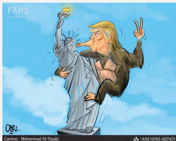
החירות שנפלה בשבי של טראמפ (פארס, 12 בנובמבר 2016).