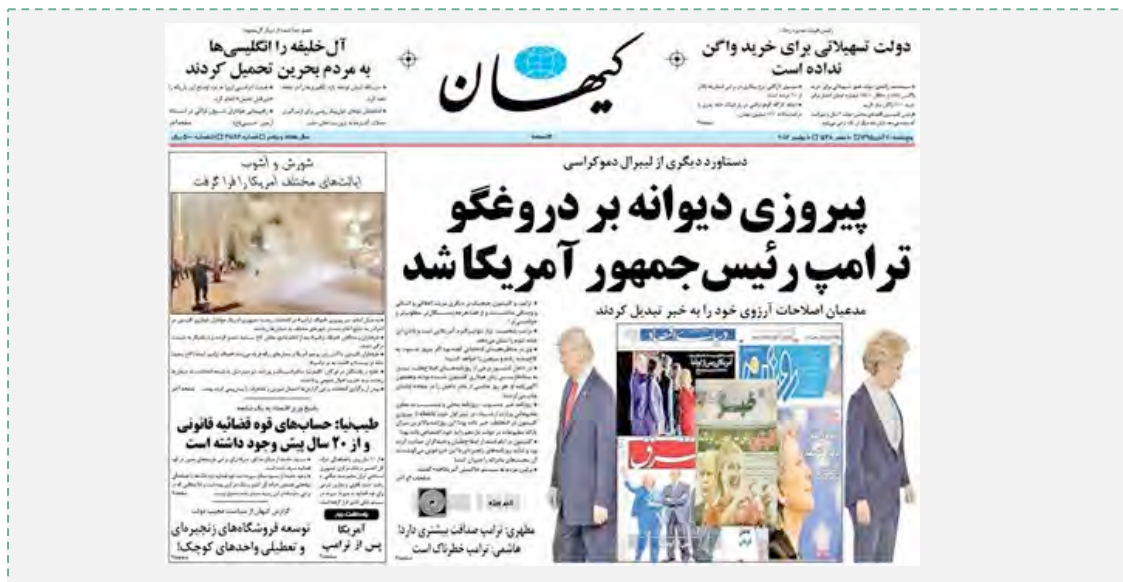
"יציחון המשוגע על השקרנית, טראמפ נבחר כנשיא ארה"ב", כותרת ראשית ביומן כיהאן, 9 בנובמבר 2016.

9. עם זאת הן הרדיקלים והן הימין השמרני נמנעו מלקרוא להפרה יזומה של הסכם הגרעין מצד איראן. ניכר, כי גם מבקריו החריפים של רוחאני מעדיפים, שהאחריות לקריסתו האפשרית של ההסכם תוטל על כתפיו של הממשל האמריקאי ולא של איראן. היומון עולם הכלכלה אף הזהיר (10 בנובמבר 2016), כי הנשיא הנבחר עלול להגביר את הלחץ על איראן במטרה לגרום לה להפר את ההסכם ביזמתה כדי שיהיה ניתן להאשים אותה בהפרתו.