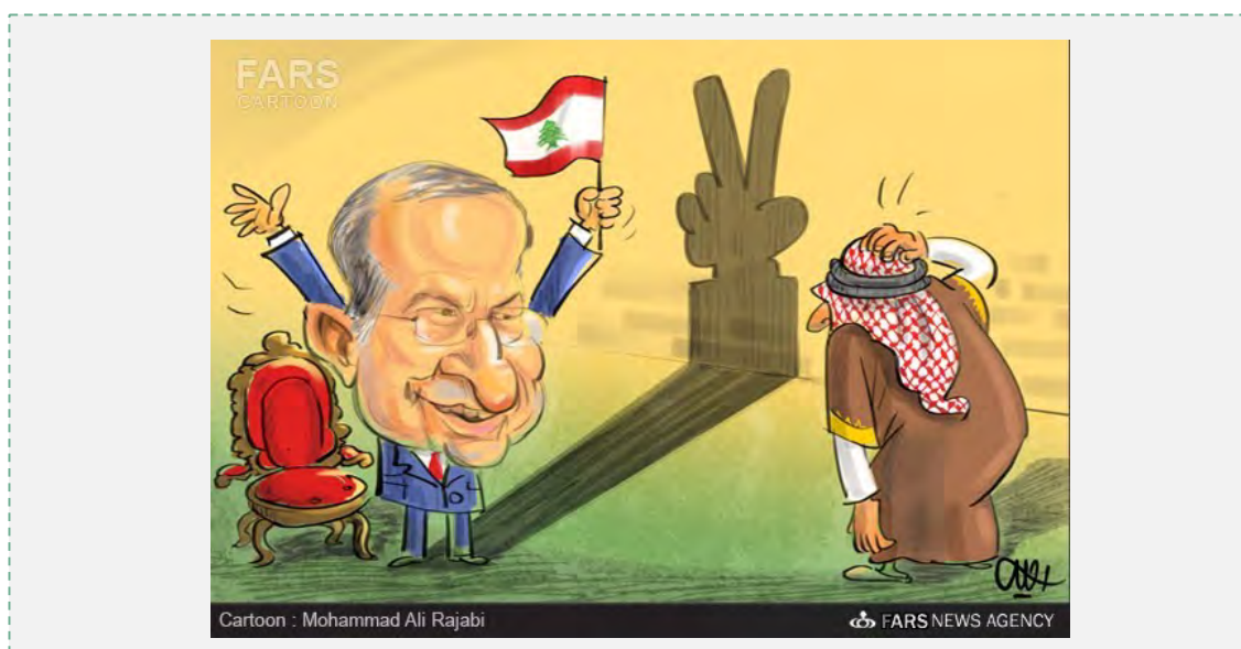
"ניצחון ההתנגדות בבחירות בלבנון" (סוכנות הידיעות פארס, 31 באוקטובר 2016).

■ עלי-אכבר ולאיתי (Ali-Akbar Velayati), יועצו לעניינים בינלאומיים של המנהיג העליון, אמר בריאיון לסוכנות הידיעות תסנים (31 באוקטובר 2016), כי בחירתו של מישל עון כנשיא היא ניצחון של ההתנגדות האסלאמית ושל מזכ"ל חזבאללה, חסן נצראללה.