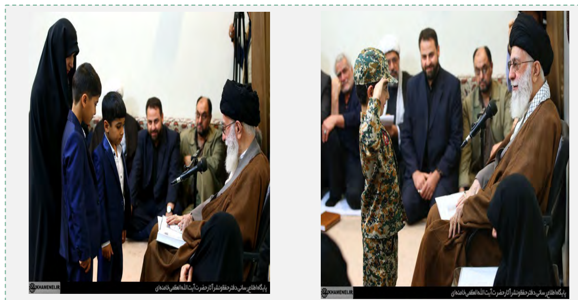
פגישת ח'אמנהאי עם משפחות חללים איראנים מהמערכה בסוריה (אתר המנהיג, 1 בנובמבר 2016).

■ מנהיג איראן, עלי ח'אמנהאי, אמר בפגישה שקיים עם משפחות לוחמים איראנים שנהרגו בסוריה, כי הוא גאה באופן מיוחד בחללים האיראנים שנהרגו בהגנה על המקומות הקדושים לשיעה בסוריה (פארס, 1 בנובמבר 2016).