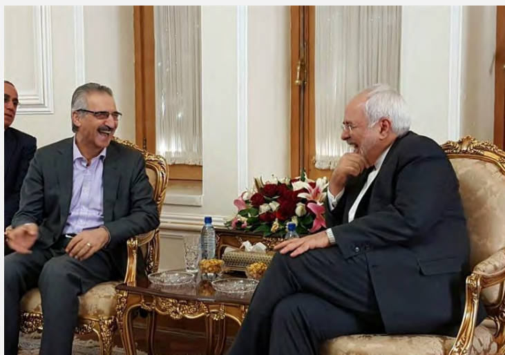
פגישת זריף – בח'ת'אר (תסנים, 31 באוקטובר 2016).

■ ראש הרשות השופטת, איתאללה צאדק אמולי לאריג'אני (Ayatollah Sadegh Amoli Larijani), ביקר בשבוע שעבר בעיראק כדי לחתום על הסכמים לשיתוף פעולה עם הרשות השופטת בעיראק. במסיבת עיתונאים בבגדאד הביע לאריג'אני תמיכה במאבק המתמשך כנגד הטרור במדינה. לאריג'אני אמר, כי הרחבת שיתוף הפעולה בין הרשויות השופטות באיראן ובעיראק תביא לחיזוק שיתוף הפעולה המדיני בין שתי המדינות (מיזאן ניוז, 30 באוקטובר 2016). במהלך ביקורו בעיראק נפגש לאריג'אני עם בכירים בממסד הדתי השיעי בעיראק, ובראשם איש הדת הבכיר, איתאללה עלי סיסטאני (Ayatollah Ali Sistani).