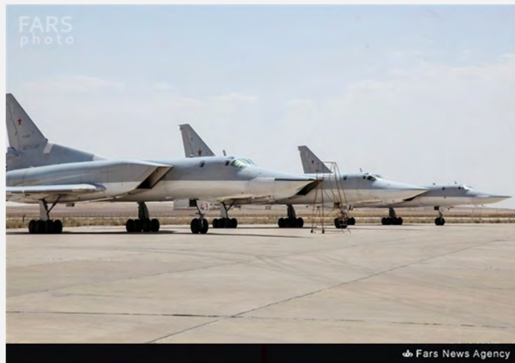
מפציצים רוסיים בשטח איראן (פארס, 16 באוגוסט 2016).

■ משרד ההגנה הרוסי אישר ב-16 באוגוסט 2016, כי רוסיה הציבה מפציצים בבסיס חיל האוויר בהמדאן (Hamedan) שבמערב איראן והחלה להשתמש בהם לצורך תקיפות אוויריות בסוריה. שר ההגנה הרוסי סרגי שויגו דיווח לכלי תקשורת רוסיים, כי ב-16 באוגוסט 2016 המריאו לראשונה מטוסים רוסיים משדה התעופה המדאן כדי לתקוף מטרות טרור בסוריה. לדבריו המדובר במפציצים אסטרטגיים ארוכי טווח מסוג Tu-22M3 ומטוסי תקיפה Su-34 שתקפו מטרות של דאעש וחזית פתח אל-שאם במחוזות חלב, דיר אלזור ואדלב. בתקיפות הללו נהרסו מתקני פיקוד ומחנות אימונים ונהרגו פעילי טרור רבים (ספוטיק, 16 באוגוסט 2016).