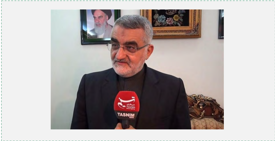
יו"ר ועדת החוץ והביטחון של המג'לס, ברוג'רדי (תסנים, 24 באוגוסט 2016).

■ יו"ר ועדת המג'לס לביטחון לאומי ולמדיניות חוץ, עלא' אלדין ברוג'רדי (Alaeddin Boroujerdi), אמר במסיבת עיתונאים, כי פעילות המטוסים הרוסים בבסיס חיל האוויר בהמדאן התבצעה במסגרת שיתוף הפעולה המתנהל בין שתי המדינות מחדר מבצעים משותף. חדר מבצעים זה פועל, לדבריו, בשנה האחרונה בדמשק ובבגדאד על בסיס החלטה משותפת שהתקבלה על-ידי איראן, רוסיה, סוריה ועיראק במסגרת המאבק בטרור (תסנים, 24 באוגוסט 2016).