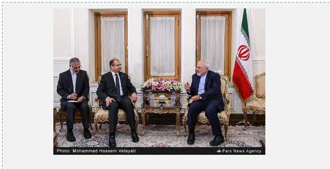
שר החוץ זריף ויו"ר הפרלמנט העיראקי (במרכז).

■ אלג'בורי הודה לאיראן על התמיכה בארצו במאבק נגד הטרור המהווה, לדבריו, הסכנה החמורה והמיידי ביותר המאיימת על האזור כולו. הוא ציין, כי אין תחליף לתפקידה של איראן באזור וכי עיראק מעריכה את עמידתה האיתנה של איראן לצד הממשלה והעם בעיראק.