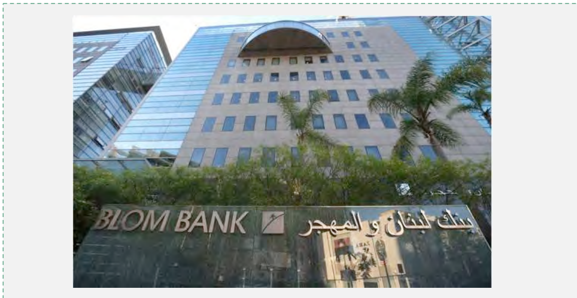
חזית בניין בנק לבנון ואלמהג'ר (BLOM BANK) בבירות (אליום אלסאבע, 13 ביוני 2016).