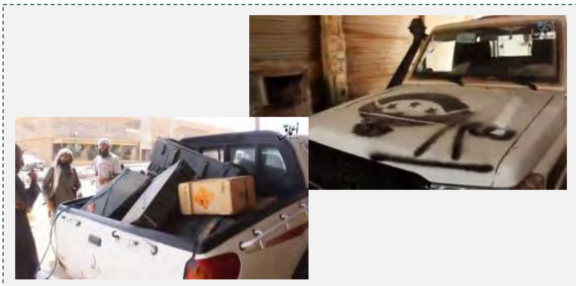
Справа: транспортное средство, принадлежавшее организации "Новая сирийская армия", и захваченное боевиками организации ИГИЛ в районе г. Абу Камаль. Слева: взрывчатые вещества и ящик с боеприпасами, захваченные боевиками организации ИГИЛ в районе г. Абу Камаль ("Аамак", 29 июня 2016 г.)