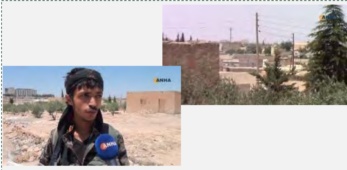
Справа: квартал Аль Асадия, расположенный в юго-восточной части г. Манбадж, который был захвачен "Военным советом г. Манбадж". Слева: боец из "Военного совета г. Манбадж" дает интервью в квартале Аль Асадия (интернет-сайт ANNA; канал Ютуб Ajansa Nawar ANNA, 2 июля 2016 г.)