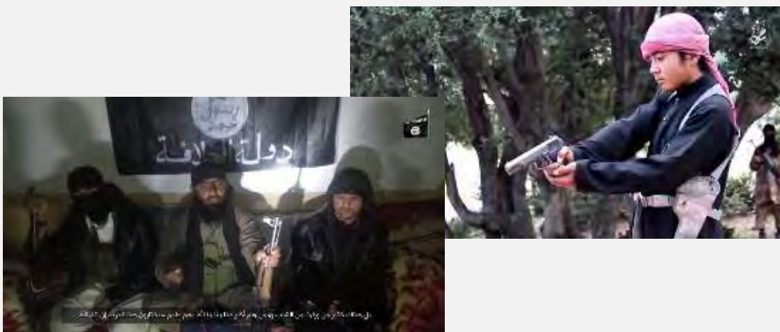
Справа: подросток совершает казнь одного из талибов, которые были взяты в плен боевиками организации ИГИЛ. Слева: боевик организации ИГИЛ (в центре), который взорвал себя в ходе нападения на пакистанское консульство в г. Джелалабад (агентство новостей "Хек", 2 июля 2016 г.)