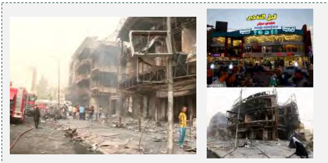
Справа: торговый центр в Багдаде, до и после теракта (агентство новостей "Хек", 3 июля 2016 г.). Слева: снимок с места совершения теракта (газета "Аль Сумария", 3 июля 2016 г.)

совершение этого теракта, который, по утверждению организации, был совершен против скопления шиитов, террористом по прозвищу Абу Маха Иракский . В тот же день (2-го июля 2016 г.) был совершен еще один теракт, в квартале Аль Шааб , расположенном в северной части Багдада, и большую часть населения которого также составляют шииты. Взрывное устройство было приведено в действие поздно ночью, в результате чего 12 человек было убито, а еще 12 – получили ранения (газета "Буабат Аль Араб", 4 июля 2016 г.).