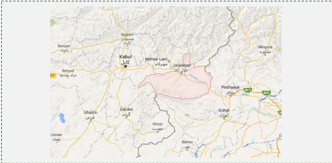
Провинция Нанджархар (обозначена розовым цветом), со столицей в г. Джелалабад, расположенная к западу от Кабула, неподалеку от границы с Пакистаном (Google Maps)