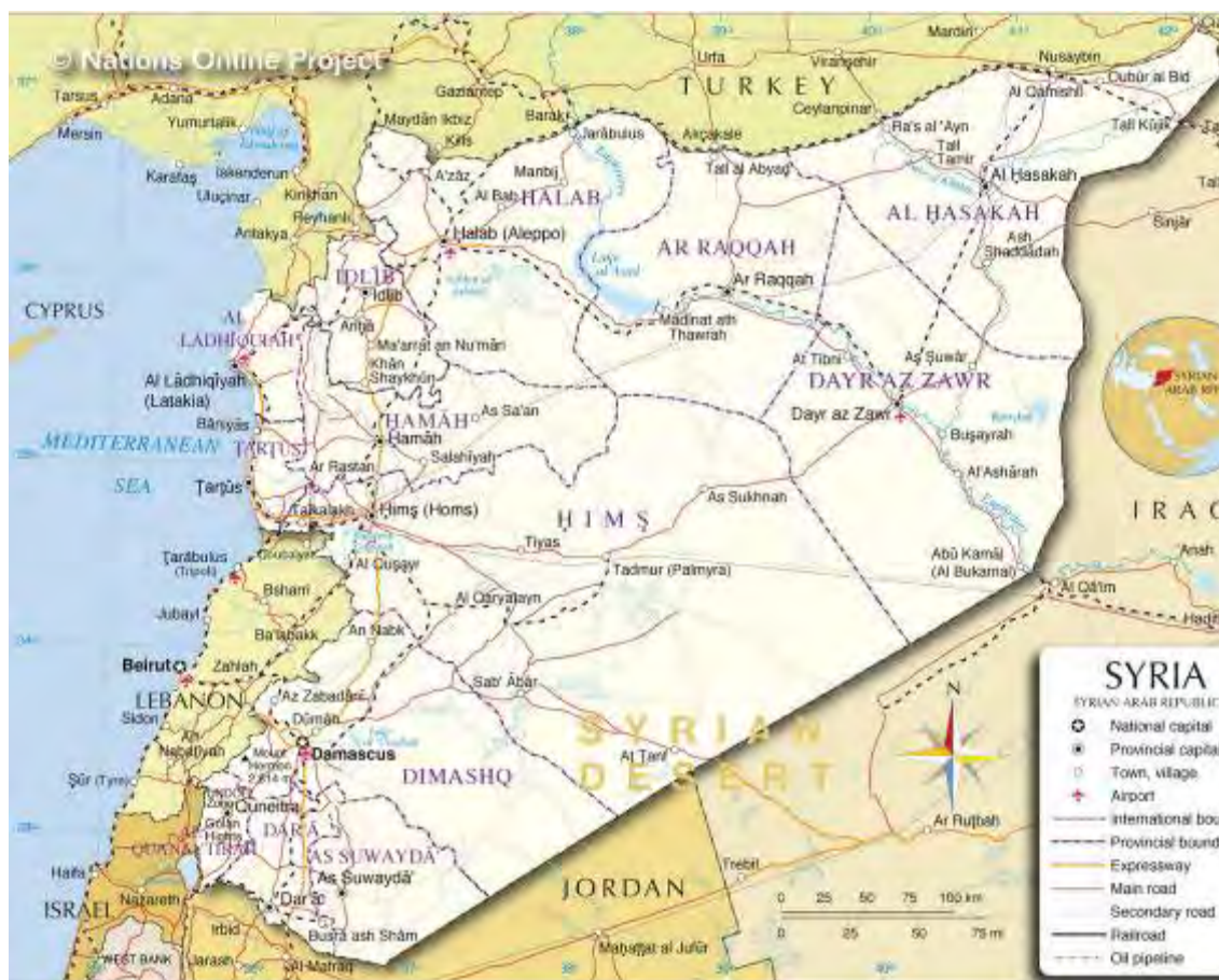
Карта Сирии (www.nationsonline.org)