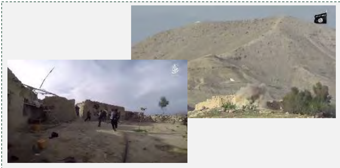
Справа: обстрел позиции Талибан. Слева: захват позиции боевиками организации ИГИЛ (агентство новостей "Хек", 2 июля 2016 г.)