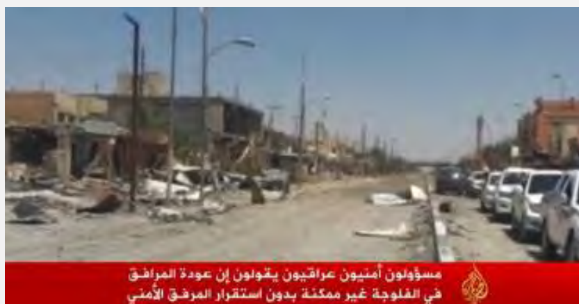
Разрушения в центральной части города (телеканал "Аль Джазира", 2 июля 2016 г.)

■ Иракское правительство предполагает, что в ходе ближайших недель в г. Аль Фалуджа начнут возвращаться жители, которые сбежали из него. Снимки, поступающие из города, демонстрируют, что в городе были произведены значительные разрушения. Иракский министр планирования сообщил, что первым шагом его министерства будет открытие бюро по округу Аль Фалуджа, для того, чтобы возобновить предоставление общественных услуг жителям города (телеканал "Аль Джазира", 2 июля 2016 г.).