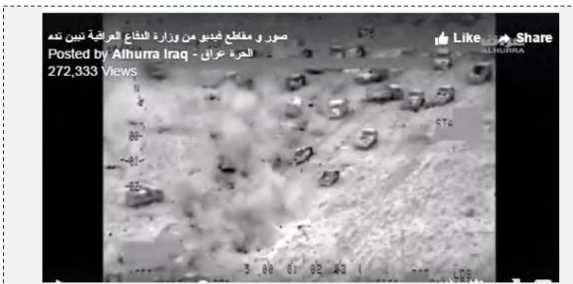
Транспортные средства организации ИГИЛ, которые были уничтожены в результате атаки с воздуха (газета "Аль Хара", 30 июня 2016 г.)

■ Район г. Аль Фалуджа: на этой неделе из американских источников поступили сообщения о том, что не менее 250 боевиков организации ИГИЛ были убиты в результате атаки с воздуха, предпринятой силами стран коалиции против автоколонны организации ИГИЛ в районе г. Аль Фалуджа. Американские источники опубликовали ролик, в котором четко наблюдается большое число попаданий, полученных транспортными средствами организации ИГИЛ (газета "Аль Хара", 30 июня 2016 г.).