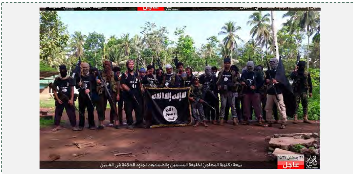
Боевики боевиками "Батальона Аль Махаджар" демонстрируют флаг организации ИГИЛ (muslim.org, 4 июля 2016 г.)