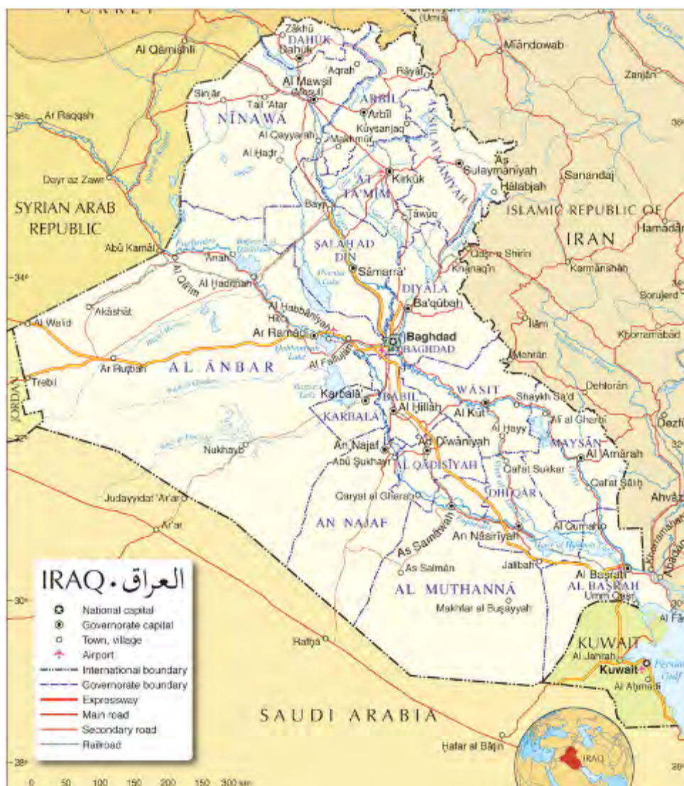
Карта Ирака