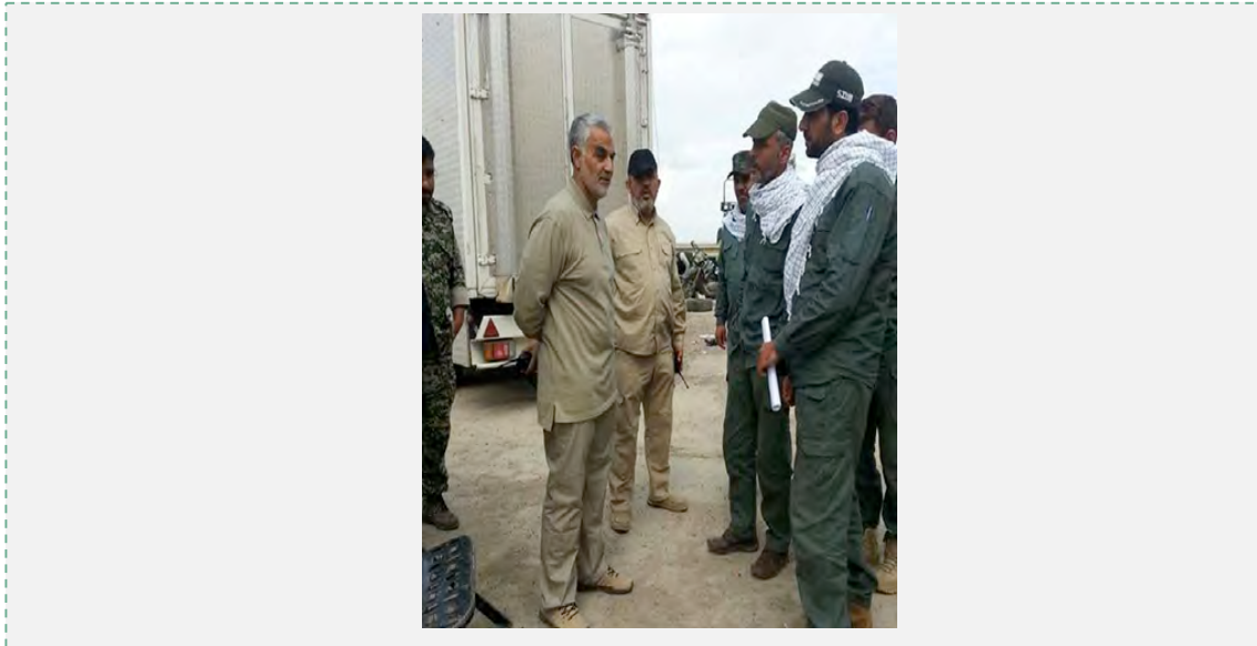
קאסם סלימאני במחוז הסוני אל-אנבאר (אנתח'אב, 26 בדצמבר 2016).