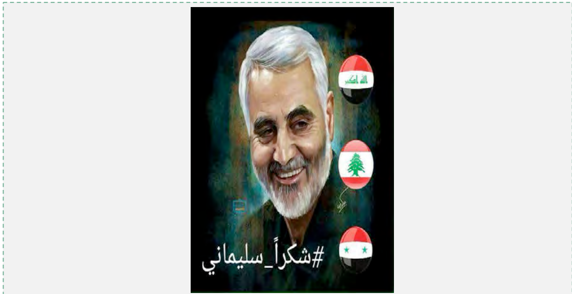
"תודה, סלימאני" (פייסבוק, 2 במאי 2016).

20. הביקורת הפנימית בעיראק נגד המעורבות האיראנית בענייניה הפוליטיים הפנימיים הגיעה לאחרונה לשיאה במהלך המשבר הפוליטי, שפרץ באפריל 2016, בין ראש הממשלה אלעבאדי, לפרלמנט העיראקי על רקע תוכנית הרפורמות שראש הממשלה מנסה לקדם. בסוף אפריל יזמו תומכי מקתדא אלצדר, איש דת ופוליטיקאי בעל השפעה בקרב השיעים בעיראק, מחאה אלימה והשתלטו באופן זמני על בניין הפרלמנט העיראקי. במהלך ההשתלטות השמיעו המפגינים העיראקים קריאות אנטי-איראניות חריפות ומחו נגד ניסיונות איראן להתערב בהתפתחויות הפוליטיות במדינה. מנגד, יזמו גולשים פרו-איראנים, ככל הנראה בעידוד או בהכוונה ישירה מאיראן, קמפיין ברשתות החברתיות תחת הכותרת: "תודה, סלימאני". המערכה נועדה, לדברי יוזמיה, להוקיר תודה למפקד כוח קדס על פועלו וסיועו במערכה להדיפת דאעש בעיראק ובסוריה.