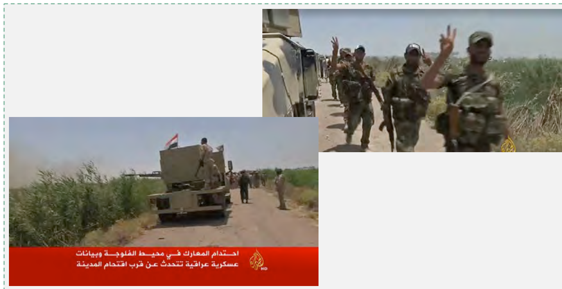
כוחות צבא עיראק בפאתי אלפאלוג'ה (אלג'זירה, 29 במאי 2016).

3. בשלב הראשון של המערכה (23 במאי 2016) התמקד מאמץ צבא עיראק בכיבוש כפרים ועיירות מסביב לאלפאלוג'ה וביצוע ירי ארטילרי לעבר העיר. ב-23 במאי 2016 הודיע מפקד אגף המבצעים של צבא עיראק, כי הצבא כבש את העיירה אלכרמה, הממוקמת כ-16 ק"מ מצפון מערב לאלפאלוג'ה. כיבוש העיירה העניקה לצבא עיראק נקודת זינוק טובה להמשך המערכה. בשלב השני, שהחל ב-24 במאי 2016 , התקדם צבא עיראק בסיוע המיליציות השיעיות לפאתי העיר אלפאלוג'ה, הידק את המצור עליה והעמיק את שליטתו במרחב שמסביב לה .