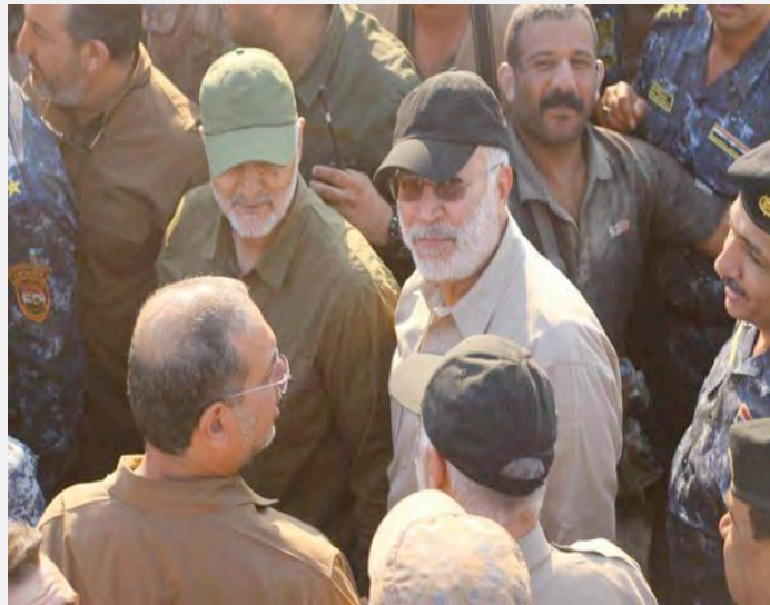
קאסם סלימאני ואבו מהדי אלמהנדס, מפקד המיליציה השיעית "גדודי חזבאללה", באזור אלפאלוג'ה (טוויטר, 26 במאי 2016).

22. הדגשת מעורבות משמרות המהפכה בנעשה בעיראק, ומעורבותו של קאסם סלימאני באופן אישי במערכה נגד דאעש בעיראק אינם מקריים. הם נועדו לחזק את הדימוי ההרתעתי של איראן ושל משמרות המהפכה כגורם המשפיע ביותר במזרח התיכון הפועל בנחישות נגד אויביה של איראן, ובראשם דאעש, ארצות-הברית וישראל. קאסם סלימאני הפך באופן אישי סמל לעוצמה האיראנית באזור ולמשטר האיראני יש, איפא אינטרס ברור להאדיר את דמותו הן מבית והן מחוץ. זאת גם כאשר מידת מעורבותו בניהול הלחימה בעיראק והשפעתו על האירועים בשטח פחתו באופן משמעותי.