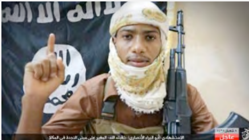
המחבל המתאבד, שביצע פיגוע נגד צבא תימן בעיר אלמכלא (חשבון הטוויטר @Moheb23s , 15 במאי 2016).

■ פעילי דאעש ביצעו מספר פיגועים נגד כוחות צבא תימן בחצ'רמות , שבדרום מזרח המדינה. ב-15 במאי 2016 פוצץ מחבל מתאבד חגורת נפץ שנשא על גופו בכניסה למחנה אלנג'דה של צבא תימן בעיר אלמכלא, בירת מחוז חצ'רמות. כמאה חיילים נהרגו ונפצעו (Yemen Press, 15 במאי 2016). מחוז חצ'רמות של דאעש קיבל אחריות לפיגוע (חשבון הטוויטר @Moheb23s , 15 במאי 2016).