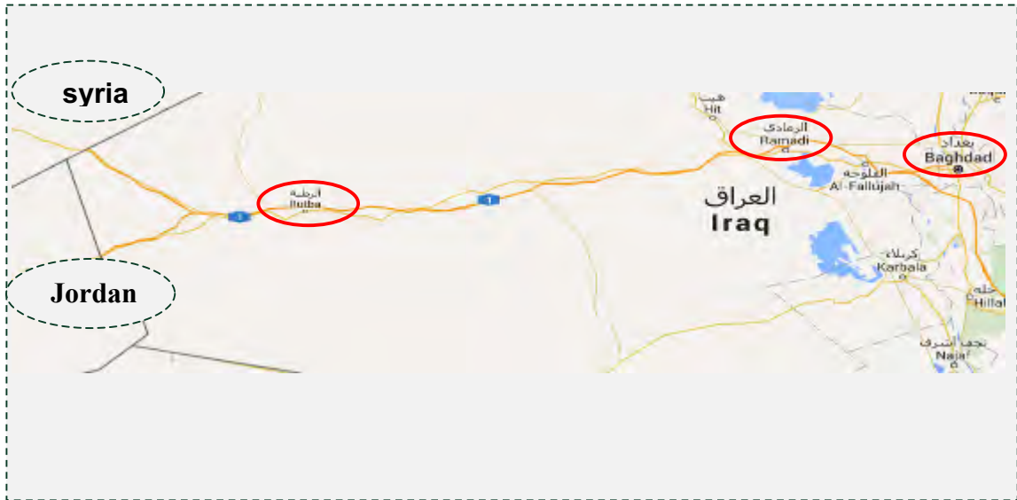
העיר אלרטבה, שבקרבת משולש הגבולות.