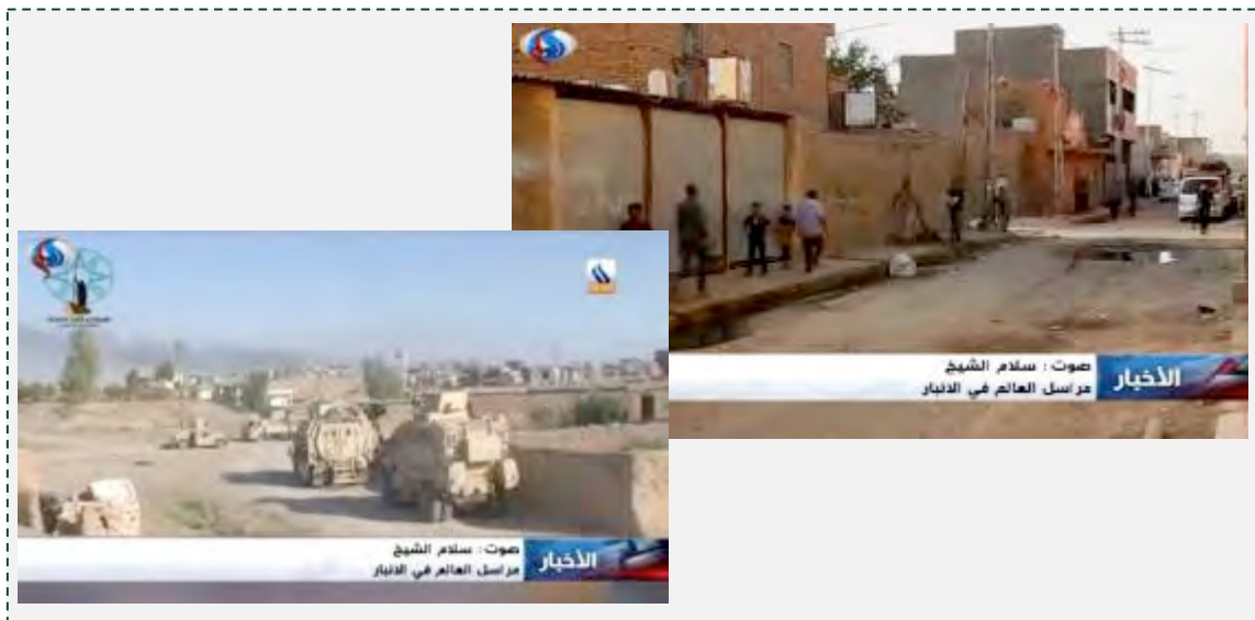
העיר אלרטבה לאחר שחרורה מידי דאעש (אלעאלם, 17 במאי 2016).

■ לעיר אלרטבה חשיבות רבה בשל קרבתה לכביש הראשי המוביל לסוריה ולירדן ולמשולש הגבולות, שבין בגדאד לדמשק. כיבושה מהווה מכה נוספת לדאעש. להערכתנו הוא עשוי להגביר את הלחץ על נוכחות דאעש במחוז הסוני אלנבאר ולפגוע בקשר הלוגיסטי והמבצעי שבין דאעש בעיראק לדאעש בסוריה. ניתן להניח כי גם לאחר כיבוש העיר ינסה דאעש לתקוף את צבא עיראק באמצעות פעולות גרילה, תוך ניצול קווי האספקה הארוכים שבין אלרמאדי לבין העיר אלרטבה.