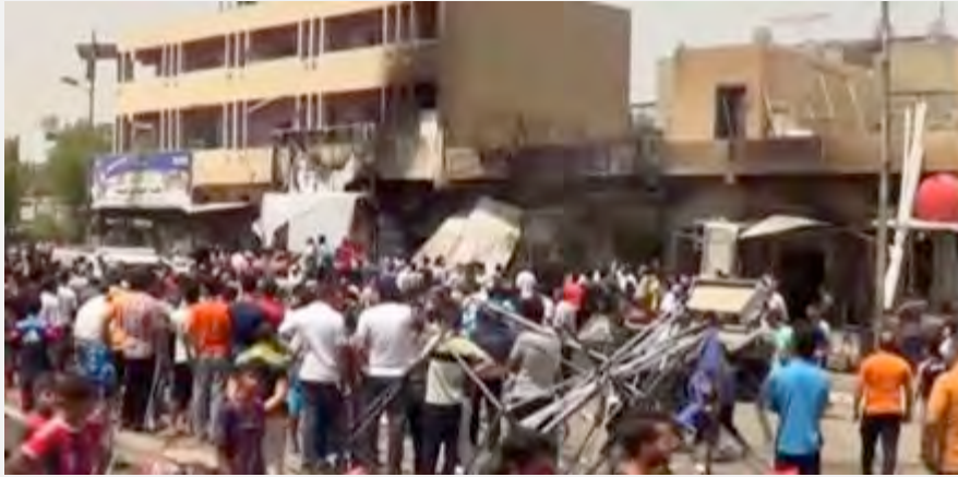
זירת הפיגוע בשכונה השיעית מדינת אלצדר בבגדאד (אלג'זירה, 11 במאי 2016).

2016) בשכונה שיעית אלשעב , שבצפון בגדאד. בפיגוע נהרגו קרוב לארבעים בני אדם ולפחות 140 נפצעו. הפיגוע באלשעב היה הבולט בסדרת פיגועים, שבוצעו ב-17 במאי 2016.