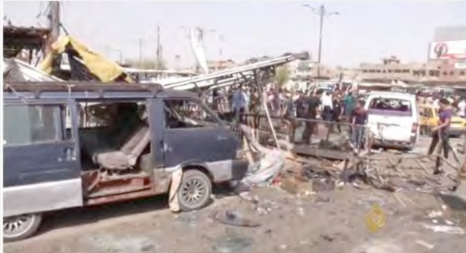
זירת הפיגוע בשכונת אלשעב (אלג'זירה, 18 במאי 2016).

■ להלן רשימה (חלקית) של פיגועים נוספים שבוצעו ע"י דאעש ברחבי בגדאד קודם לסדרת הפיגועים ב-17 במאי 2016: