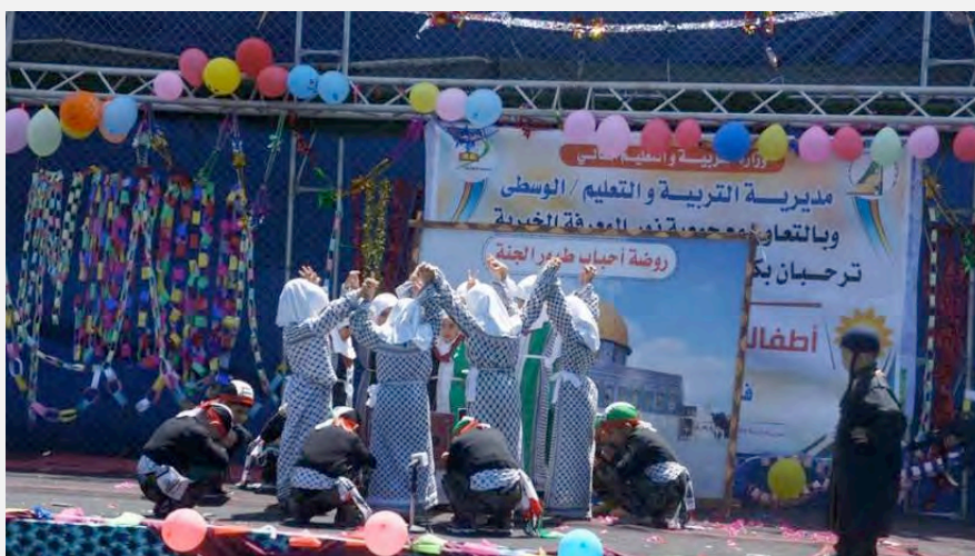
מופע בו הילדים מגנים על הר הבית מפני היהודים. מצד ימין מופיע ילד המחופש ליהודי חרדי (דף הפייסבוק של אגודת נור אלמערפה, 19 באפריל 2016)

ב. מופע בו נראים ילדים פלסטינים מגנים על הר-הבית מפני היהודים. במופע השתתף ילד המחופש לחרדי עם פאות (דף הפייסבוק של אגודת נור אלמערפה, 19 באפריל 2016).