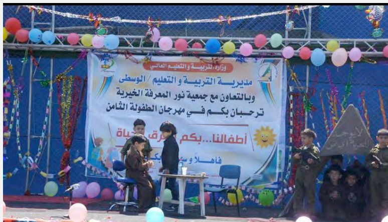
מופע המדמה חיילי צה"ל חמושים כולאים אסירים פלסטינים (דף הפייסבוק של אגודת נור אלמערפה, 19 באפריל 2016)

א. מופע המדמה חיילי צה"ל חמושים כולאים אסירים פלסטינים. במיצג נראה אוהל בו ישבו הילדים, שהציגו אסירים פלסטינים. על האוהל נכתב: "אין מחיר לחופש".