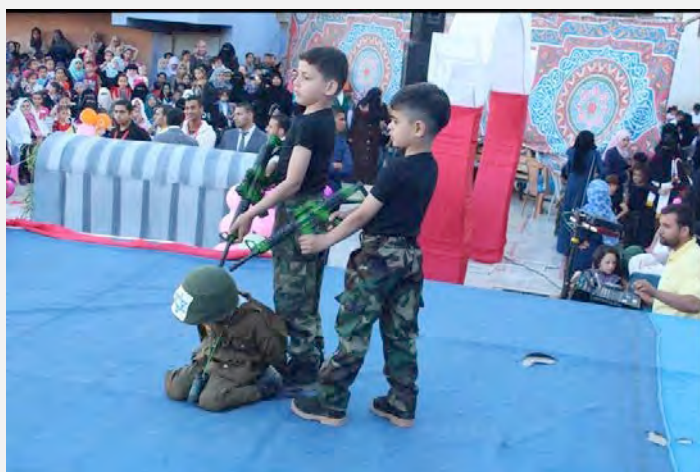
ילדים מכניעים חייל ישראלי (דף הפייסבוק של האגודה האסלאמית בח'אן יונס, 6 במאי 2016)