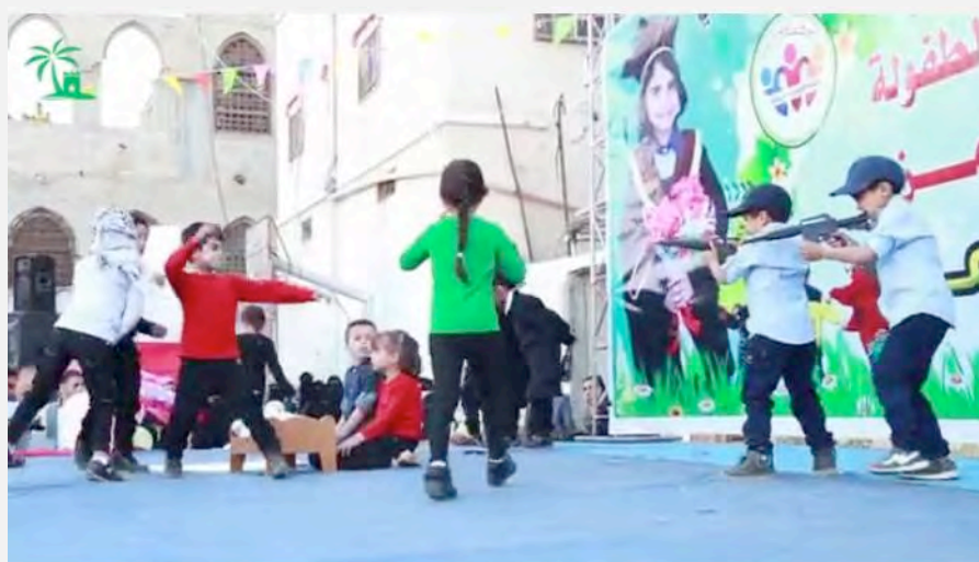
מופע המדמה תקיפת כוחות ביטחון ישראלים באמצעות אבנים (יוטיוב, 5 במאי 2016)