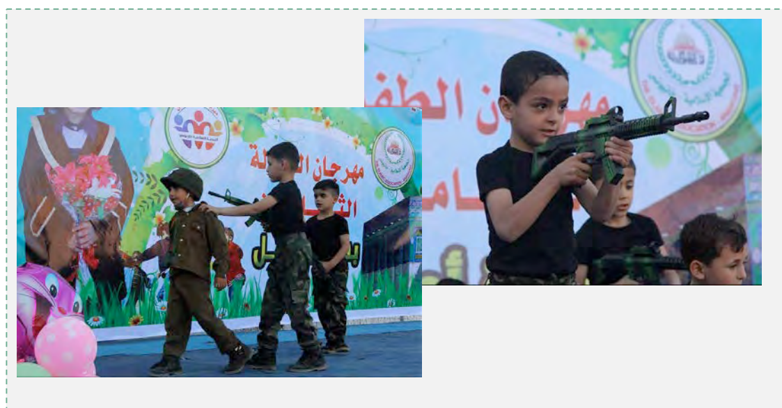
ילדים בשלל פעולות צבאיות (דף הפייסבוק של האגודה האסלאמית בח'אן יונס, 6 במאי 2016).