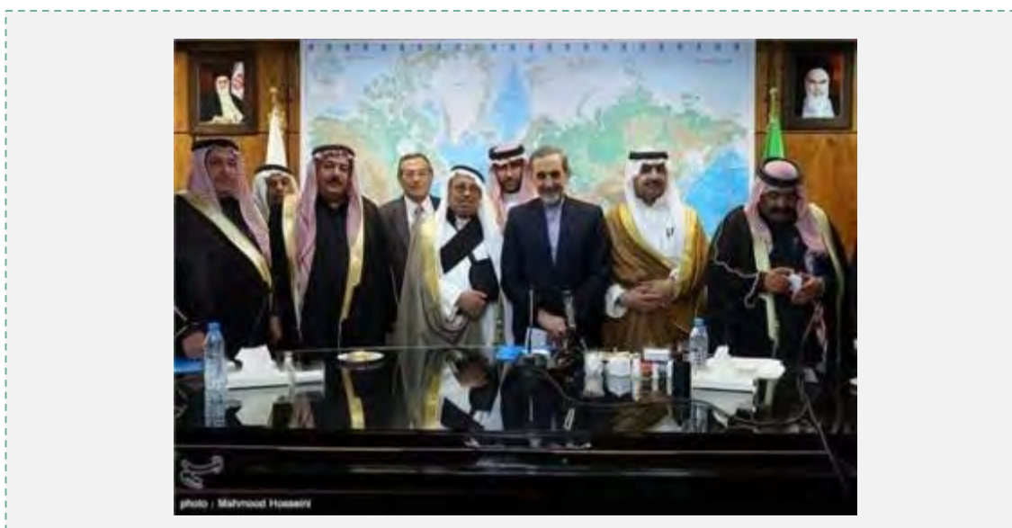
פגישת ראשי השבטים הסורים עם עלי-אכבר ולאיתי (תסנים ניוז, 27 באפריל 2016).