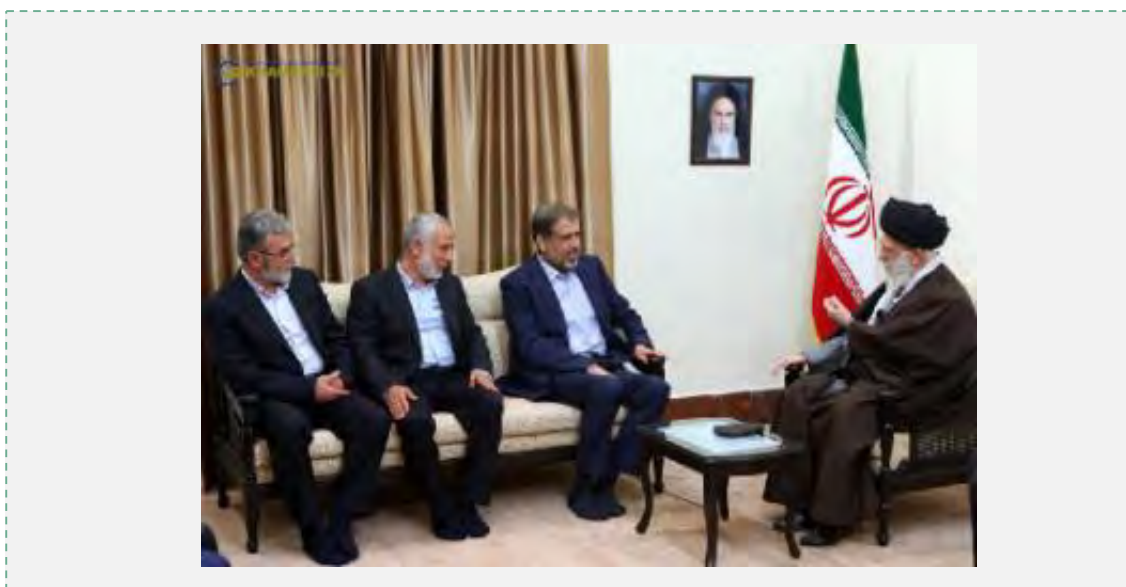
פגישת רמז'אן שלח עם מנהיג איראן (אתר המנהיג, 1 במאי).

■ משלחת של הג'האד האסלאמי בפלסטין בראשות מזכ"ל הארגון, רמז'אן עבדאללה שלח, קיימה בשבוע שעבר ביקור באיראן. במהלך הביקור נפגשה המשלחת עם בכירים איראנים, ובהם המנהיג העליון, עלי ח'אמנהאי; שר החוץ, מחמד-ג'ואד זריף; יו"ר המועצה העליונה לביטחון לאומי, עלי שמח'אני; יו"ר המועצה לקביעת האינטרס של המשטר, עלי-אכבר האשמי רפסנג'אני; ויו"ר המג'לס, עלי לאריג'אני. בפגישות דנו נציגי איראן והג'האד האסלאמי בהתפתחויות בעזה ובגדה המערבית. הבכירים האיראנים שבו וציינו את מחויבות איראן להמשיך ולסייע לפלסטינים. בפגישתו עם שלח אמר ח'אמנהאי, כי ההגנה על הפלסטינים כיום היא סמל להגנה על האסלאם (אירנ"א, 1-2 במאי 2016).