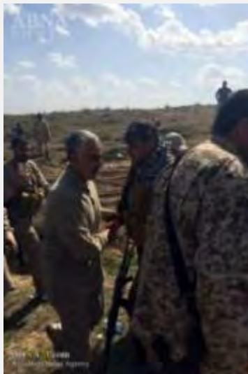
קאסם סלימאני בחלב (אבנ"א, 4 במאי 2016).

■ סלימאני עצמו קיים בימים האחרונים ביקור באזור חלב שבסוריה כדי לפקח על מצב הלחימה באזור (אבנ"א, 4 במאי 2016).