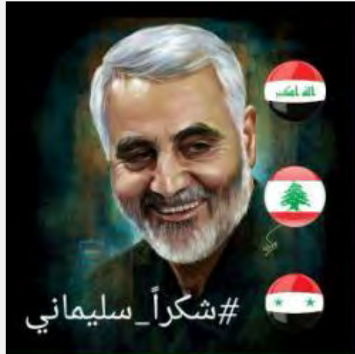
"תודה, סלימאני" (פייסבוק, 2 במאי 2016).

גם בקרב השיעים בעיראק קיימת הסתייגות ממעורבותה של איראן בענייניה הפוליטיים הפנימיים של עיראק.