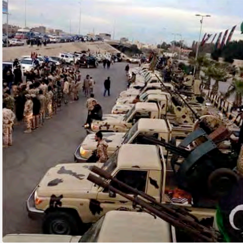
הערכות צבא לוב לשחרור העיר סרת (חשבון הטוויטר @MORASELTOBRUK, 10 באפריל 2016).

■ בתקשורת הלובית דווח כי צבא לוב נערך לשחרור העיר סרת, מעוזו של דאעש בלוב. נמסר כי, לנוכח זאת פרס עשרות צלפים מקרב אנשיו על גגות מבנים גבוהים בעיר ומיקש מספר אזורים בעיר ובסביבתה (סוכנות הידיעות הלובית, 9 באפריל 2016; אלביאן, 11 באפריל 2016).