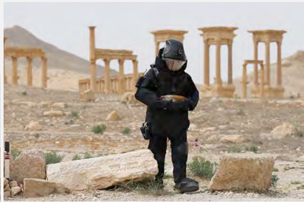
כוחות חבלה רוסים מפנים מוקשים ומטענים בעיר תדמור (משרד ההגנה הרוסי, eng.mil.ru)

■ במקביל נמסר, כי החלו עבודות שיקום תדמור וכי תושבי העיר שנמלטו ממנה החלו לשוב אליה. ב-9 באפריל 2016 דווח, כי כאלפיים מתושבי תדמור שנמלטו לחמץ, שבו לבתיהם. כמו כן החלו תושבים לשוב לבתיהם באלקרייתין (סאנא, 9 באפריל 2016).