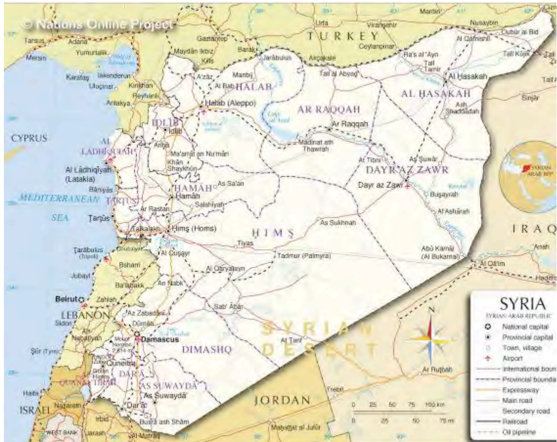
מפת סוריה (www.nationsonline.org).