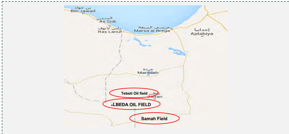
שדות נפט, שמדרום למרדה, המאוימים ע"י דאעש.