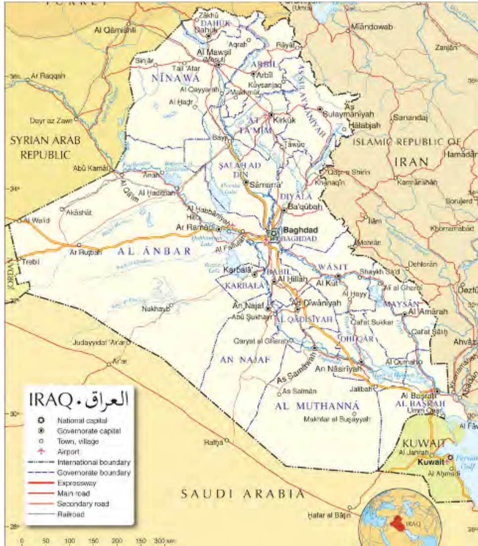
خارطة العراق (www.nationsonline.org).

■ في مؤتمر صحفي عقده جون كيري وزير الخارجية الأمريكي أثناء زيارته للعراق، قال أن مقاتلي داعش لم يقوموا بهجمات في العراق منذ شهر عدة. وعلى حد قوله فإن داعش يخسر يومياً أراضي وأموال ومقاتلين وهو الآن في حالة دفاعية. وقال كيري أن قوات التحالف قد دمرت أكثر من 1,200 حقل من حقول داعش النفطية وضربت أهدافاً أخرى تتعلق بالجهاز المالي الذي يمول التنظيم. وجاء على لسانه أن التحالف الدولي ضد داعش يعترزم زيادة الضغط على داعش بالتعاون مع العراق. وقال كيري أن حملة تحرير الموصل هي حملة عراقية صرف وستحظى بدعم التحالف الدولي (سكاي نيوز، 8 نيسان/ أبريل 2016).