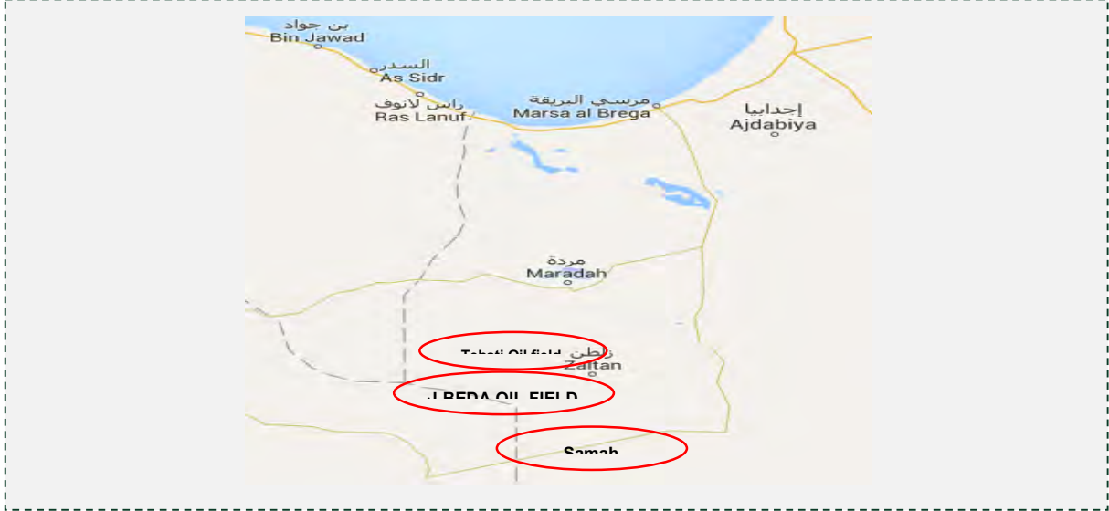
حقول النفط إلى الجنوب من مراده، والتي يهددها داعش.

■ حرس حوض مرادة- زله التابع للجيش الليبي لحكومة طبرق أعلن عن إخلاء عمال الحقول النفطية البيضاء وتيبستي والسماح، إلى الجنوب من مراده. وذلك إزاء تكرار الهجمات التي يشنها داعش في المنطقة وبعد وصول معلومات استخبارية تفيد بان داعش يحشد قواته بالقرب من حقل المبروك النفطي الذي يقع على مبعده 220 كيلومتر إلى الشمال الغربي من مراده (بورتال الوسط، 9 نيسان/ أبريل 2016; أخبار ليبيا 24، 7 و 9 نيسان/ أبريل 2016).