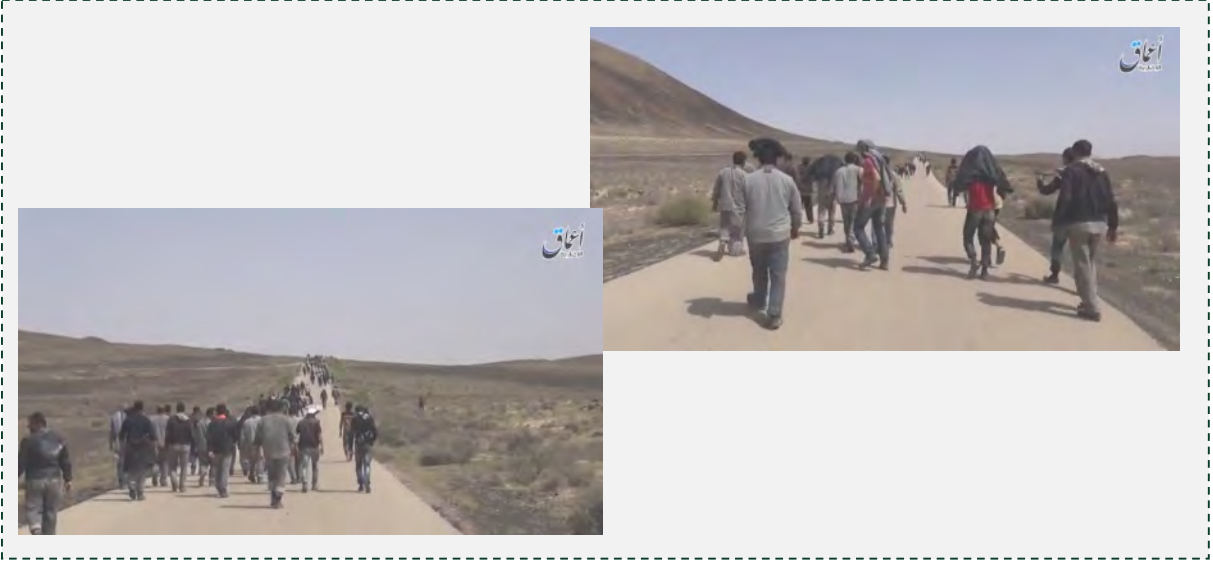
صور من شريط نشره داعش عند الإفراج عن الرهائن المحتجزون من مصنع الإسمنت (أعماق; my.pcloud; 9 نيسان/ أبريل 2016).