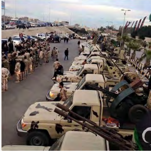
استعدادات الجيش الليبي لتحرير مدينة سرت (حساب تويتر @MORASELTOBRUK, 10 نيسان/ أبريل 2016).

■ أفادت التقارير المنشورة في وسائل الإعلام الليبية أن الجيش الليبي يستعد لتحرير مدينة سرت، معقل داعش في ليبيا. وقالت التقارير أن داعش قام بنشر عشرات القنصاة على أسطح المباني العالية في المدينة وقام بتلغيم عدد من المناطق في المدينة وفي محيطها (وكالة الأنباء الليبية، 9 نيسان/ أبريل 2016; البيان، 11 نيسان/ أبريل 2016).