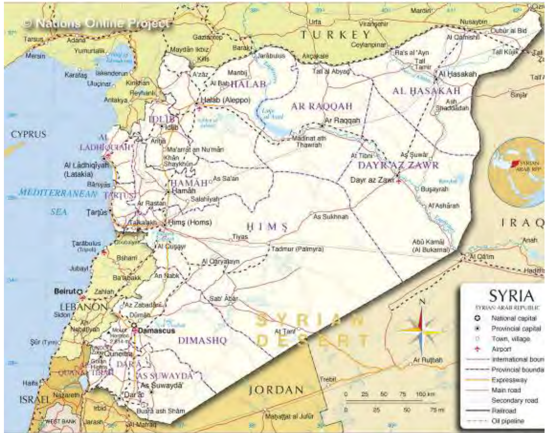
خارطة سوريا ( www.nationsonline.org ).