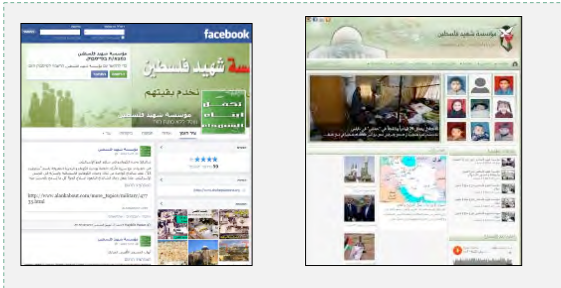
אתר האינטרנט ודף הפייסבוק של מוסד השהיד-פלסטין

4. מוסד השהיד-פלסטין (או מוסד השהיד, סניף פלסטין) הינו השלוחה הפלסטינית של קרן השהיד האיראנית , שהוקם בשנת 1993 כדי לסייע לעם הפלסטיני. עיקר פעילות הקרן הוא סיוע לבני משפחות השהידים הפלסטינים. הקרן תומכת באלפי משפחות שהידים פלסטינים, שבשטחי "פלסטין" ומחוצה לה. משרדי מוסד השהיד-פלסטין ממוקמים בלבנון משם הם עומדים בקשר עם גופים שונים ברצועת עזה וביהודה ושומרון.