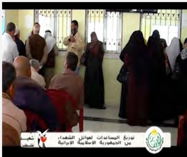
חלוקת כספי הסיוע האיראני למשפחות השידדים (פארס, 9 בנובמבר 2015).

1. העברת כספים למשפחות המחבלים באמצעות אגודות צדקה הינה דרך הפעולה המסורתית הנקוטה ע"י איראן וקרן השיד. על פי מידע עדכני מועברים כספי קרן השיד האיראנית לרצועת עזה באמצעות אגודת צדקה בשם אלאנצאר, המזוהה עם ארגון הג'האד האסלאמי בפלסטין. אגודת צדקה זאת, שנוסדה בתקופה האנטיפאדה השנייה (2001), משמשת כיום עבור האיראנים כצינור המרכזי להעברות הכספים לרצועה. האגודה מסייעת למשפחות מחבלים שנהרגו, למשפחות, שבתיהן נהרסו, ולמשפחות מחבלים הכלואים בישראל בעבר סייעה אגודת אלאנצאר גם למשפחות שהידים ביהודה ושומרון, אולם לא נראה שסיוע זה מועבר כיום.