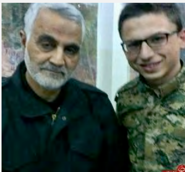
מפקד כוח קדס של משמרות המהפכה, קאסם סלימאני, לצד חייל רוסי בסוריה (תאבנאכ, 19 בפברואר 2016).

■ קאסם סלימאני (Qasem Soleimani), מפקד כוח קדס של משמרות המהפכה, התייחס במהלך פגישה, שקיים בשבוע שעבר עם משפחות לוחמי משמרות המהפכה, שנהרגו בסוריה, לאירועי מלחמת לבנון השניה (2006). סלימאני אמר, כי במהלך המלחמה שהה עם בכירי חזבאללה בלבנון. בתום השבוע הראשון ללחימה הוא שב לטהראן ונפגש עם עלי לאריג'אני (כיום יו"ר המג'לס), מזכיר המועצה העליונה לביטחון לאומי דאז, והשניים נסעו יחדיו לעיר משהד בה נפגשו עם המנהיג העליון, עלי ח'אמנהאי. לדברי סלימאני, במהלך הפגישה העביר ח'אמנהאי הנחיות ששינו, את גורל המלחמה. סלימאני לא פירט את תוכן ההנחיות שהעביר ח'אמנהאי (איסנ"א, 23 בפברואר 2016).