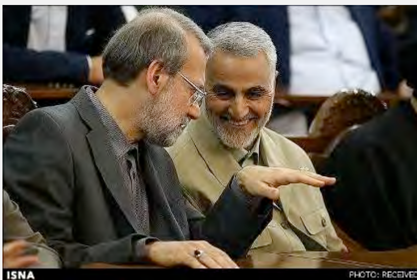
קאסם סלימאני ועלי לאריג'אני (איסנ"א, 23 בפברואר 2016).

■ קאסם סלימאני (Qasem Soleimani), מפקד כוח קדס של משמרות המהפכה, התייחס במהלך פגישה, שקיים בשבוע שעבר עם משפחות לוחמי משמרות המהפכה, שנהרגו בסוריה, לאירועי מלחמת לבנון השניה (2006). סלימאני אמר, כי במהלך המלחמה שהה עם בכירי חזבאללה בלבנון. בתום השבוע הראשון ללחימה הוא שב לטהראן ונפגש עם עלי לאריג'אני (כיום יו"ר המג'לס), מזכיר המועצה העליונה לביטחון לאומי דאז, והשניים נסעו יחדיו לעיר משהד בה נפגשו עם המנהיג העליון, עלי ח'אמנהאי. לדברי סלימאני, במהלך הפגישה העביר ח'אמנהאי הנחיות ששינו, את גורל המלחמה. סלימאני לא פירט את תוכן ההנחיות שהעביר ח'אמנהאי (איסנ"א, 23 בפברואר 2016).