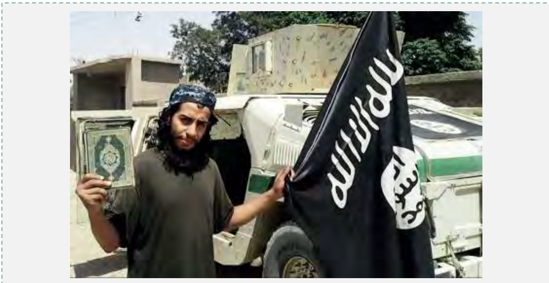
עבד אלחמיד אבעוד עם דגל דאעש בעת שהותו בסוריה (דאביק, גליון 7, פברואר 2015).

9. בפברואר 2015 פורסם ראיון של עבד אלחמיד אבעוד בביטאון דאעש דאביק. הראיון נועד להערכתנו לעודד פעילים אירופאים לצאת למשימות טרור מטעם דאעש במדינות מוצאם. זאת ע"י פיאר "עלילותיו" של עבד אלחמיד אבעוד בבלגיה ובאירופה תוך הדגשת הצלחתו לחמוק בשלום מכל שירותי המודיעין, שרדפו אחריו. הראיון הצביע גם על מידה רבה של ביטחון עצמי ותעוזה מצידו של דאעש, שלא היסס לתת פומבי לתמונותיו של אבעוד, ולשלוח אותו זמן קצר לאחר מכן למשימה חדשה בבלגיה ובצרפת (להערכתנו בסביבות מרץ 2015).