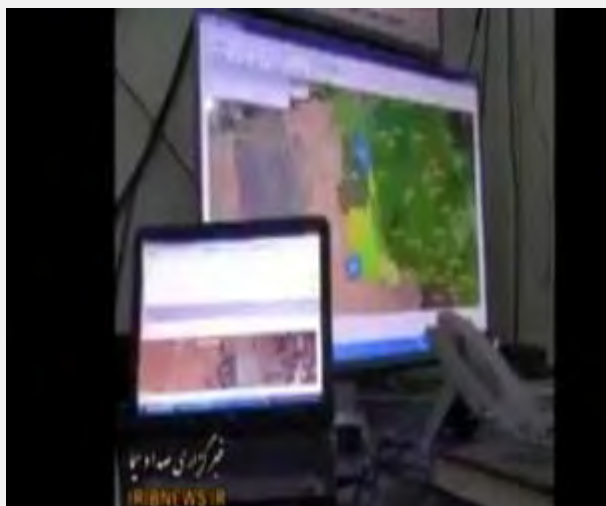
תמונות מחדר המבצעים של איראן המתאם את המערכה בסוריה (שידורי הטלוויזיה האיראנית, 23 באוקטובר 2015).