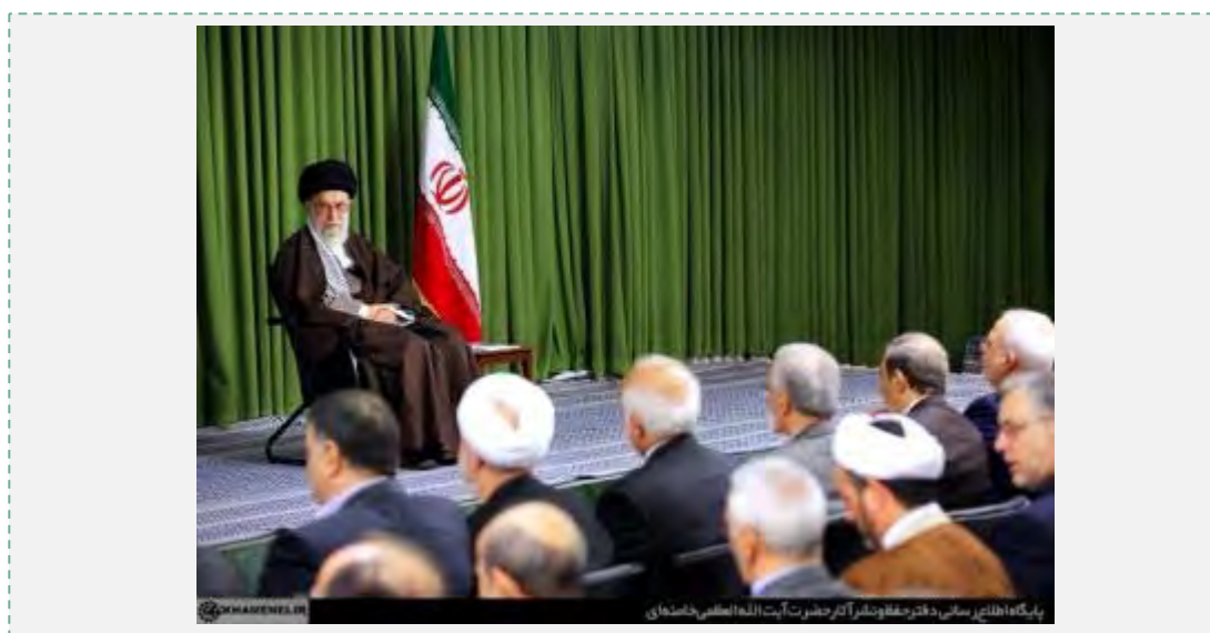
פגישת המנהיג עם שגרירים וראשי נציגויות איראניות בחו"ל

■ ח'אמנהאי ציין, כי הסיבה המרכזית להעדר ביטחון באזור היא תמיכת ארצות-הברית בישראל ובארגוני הטרור האסלאמיים וכי מדיניות זו נוגדת לחלוטין את מדיניותה של איראן. הוא שלל אפשרות למשא ומתן עם ארצות-הברית בסוגיות איזורים וטען, כי האמריקאים חותרים לכפות את האינטרסים שלהם ולא לפתור את בעיות האיזור (פארס, 1 בנובמבר 2015).