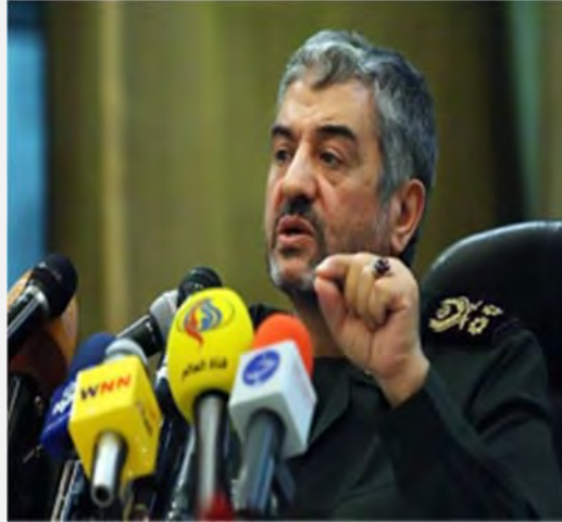
מחמד-עלי ג'עפרי (תסנים ניוז, 2 בנובמבר 2015).

■ בהתייחסות מרומזת לחילוקי דעות פנימיים בממשל האיראני בנוגע לפתרון הנדרש למשבר בסוריה אמר ג'עפרי, כי יש בכירים, שאינם מבינים מדוע איראן צריכה לגלות רגישות רבה כל כך ביחס לנשיא אסד וטוענים, שאין הבדל בין אסד למישהו אחר. הוא ציין, כי הם אינם מבינים את המצב בסוריה ואינם יודעים שלאסד יש תומכים רבים, שהעם הסורי מקבל אותו ושההתנגדות בסוריה תלויה בו. מפקד משמרות המהפכה הוסיף, כי אויבי איראן רגישים בנוגע לאסד ומוכנים להיענות לדרישותיה של איראן בנוגע למשבר בסוריה בתנאי שתאפשר את העברת אסד מתפקידו, אך איראן יודעת היטב מהו תפקידו של הנשיא אסד בהתנגדות. הוא ציין, כי איראן תהיה מוכנה לפרישתו של אסד מהשלטון רק אם אזרחי סוריה יבטאו את רצונם בכך באמצעות בחירות. ג'עפרי התייחס גם למתקפה הרוסית בסוריה ואמר, כי רוסיה מספקת כעת סיוע צבאי לרוסיה, אך לא ברור באיזו מידה היא מסכימה עם עמדותיה של איראן בסוגייה הסורית (תסנים ניוז, 2 בנובמבר 2015). דברי ג'עפרי עשויים לרמז לחילוקי דעות הן בצמרת האיראנית והן בין איראן לרוסיה סביב ההסדר הפוליטי העתידי במדינה, ובעיקר בנוגע לעתידו הפוליטי של הנשיא אסד.