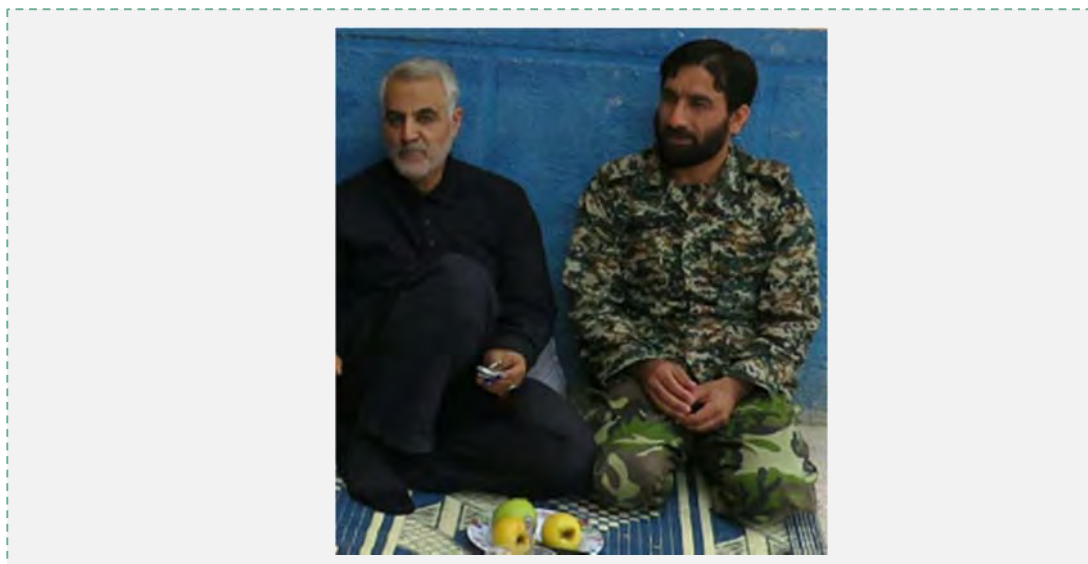
עזתאללה סלימאני עם קאסם סלימאני